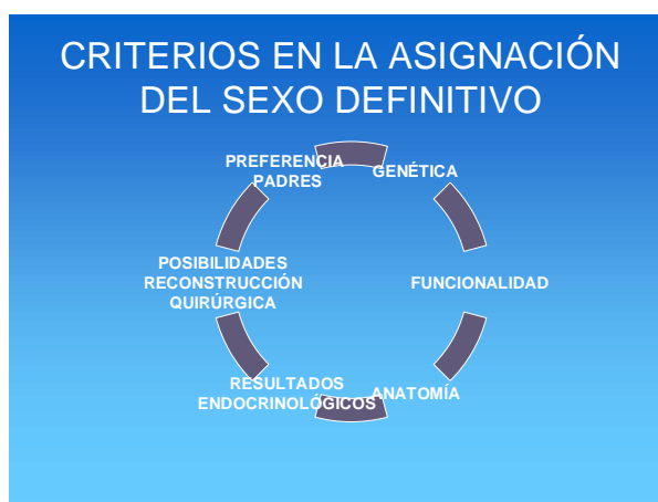
IMAGEN 1. Esquema con los criterios en la asignación de sexo definitivo en bebés intersexo (Elaboración propia).

A pesar de que en la actualidad los protocolos que John Money desarrolló son duramente criticados por el estamento médico, comprobaremos que paradójicamente, los discursos y protocolos actuales en España para situaciones intersexuales no se alejan tanto de sus orígenes. A día de hoy, los protocolos que se siguen en España para decidir el sexo definitivo que se asignará a un recién nacido intersexual responden, en mayor o menor grado 4 , a diferentes criterios: se considera la anatomía de los genitales externos, el cariotipo, el tipo de gónadas que presente –esto marcaría la capacidad reproductora futura-, los resultados endocrinológicos o respuesta hormonal, la capacidad funcional, las posibilidades de reconstrucción quirúrgica y la decisión o expectativas de los padres; aunque en última instancia, el propio criterio del profesional médico que está a cargo de esa persona, y dependiendo de la experiencia que tenga en situaciones similares, inclinará la balanza hacia lo "femenino" o hacia lo "masculino".