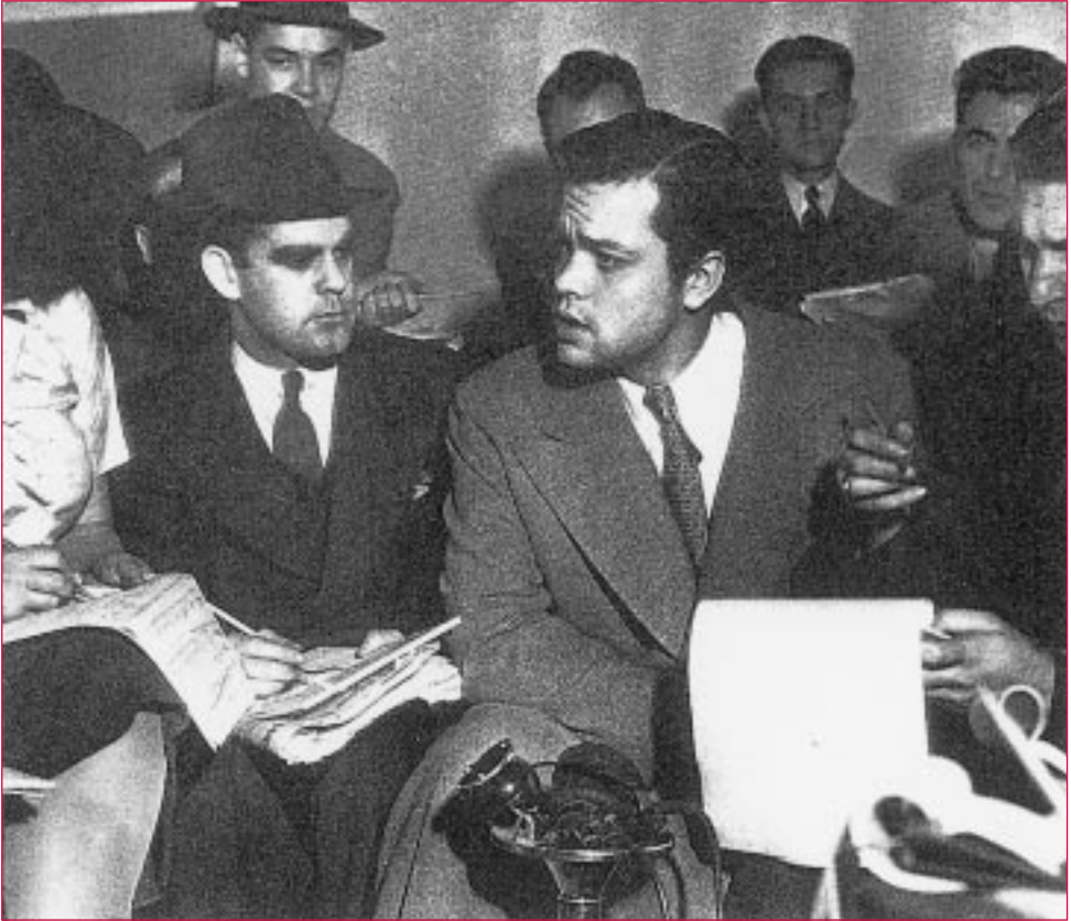
Conferencia de prensa de Orson Welles ó remata-la emisión de A guerra dos mundos .

canle WHO, onde destacou nunha curiosa especialidade. Consistía na recreación dos partidos de béisbol xogados polos Chicago Cubs. Reagan narrábaos desde Des Moines, xogase onde xogase o equipo, a partir dos telegramas que lle ían mandando desde o campo a medida que o xogo avanzaba. Loxicamente, a información era telegráfica e Reagan encargábase de poñelos detalles. Houbo unha vez na que a