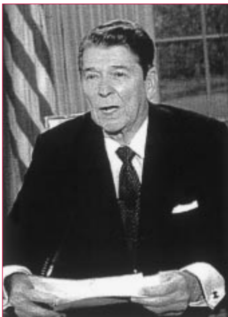
Ronald Reagan, presidente dos Estados Unidos de América, 1981-1989.