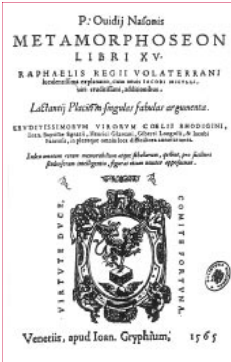
Portada da Metamorfose de Ovidio. Edición de Regius, 1565.

da imprenta, cando se rompe coa tradición anterior na que a palabra oral era predominante. A máquina de Gutenberg, ó facilita-la lectura individualizada dos textos, produce unha desconexión social, unha apropiación por parte de cada suxeito dos coñecementos que o escrito atesoura. Este período da Galaxia definida por McLuhan, que el chama moderno, dá lugar posteriormente ó período contemporáneo, que xorde cando a tecnoloxía permite a transmisión de mensaxes a través das ondas, en conexión