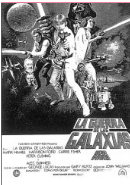
Cartel de La Guerra de las galaxias .

Outra característica desta secta milenarista, na que os seus membros morreron literalmente cos Nikes postos, era a súa absoluta inmersión na cultura trivial do consumismo norteamericano. Sabemos dos seus días previos ó suicidio colectivo: foron ó cine ver A guerra das galaxias , ó zoolóxico e ó acuario de San Diego, gravaron as súas mensaxes testamentarias, comeron pizza e tamén asistiron á proxección de