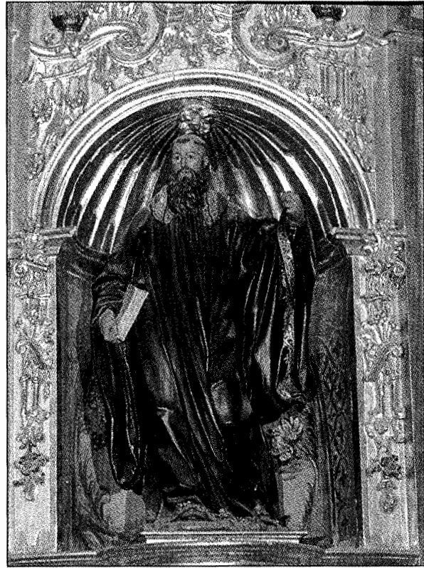
San Millán de Yuso. Imágenes de los retablos del trascoro.