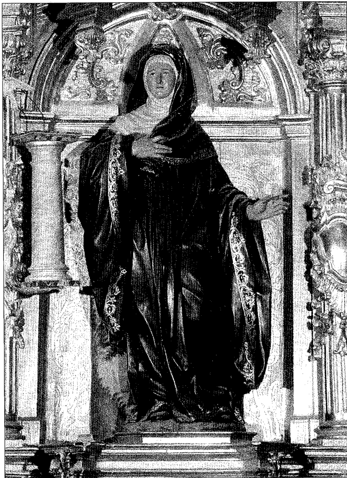
San Millán de Yuso. Santa Aurea.