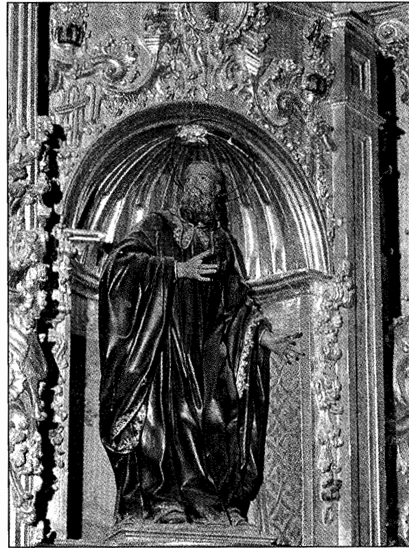
San Millán de Yuso. Imágenes de los retablos del trascoro.