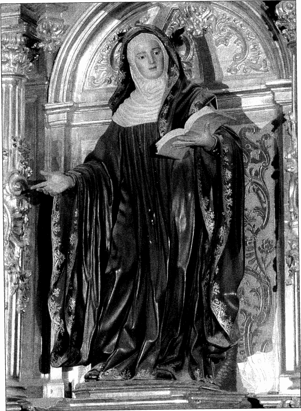
San Millán de Yuso. Santa Potamia.