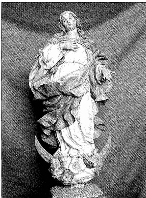
San Millán de Yuso. Inmaculada Concepción de la Biblioteca.