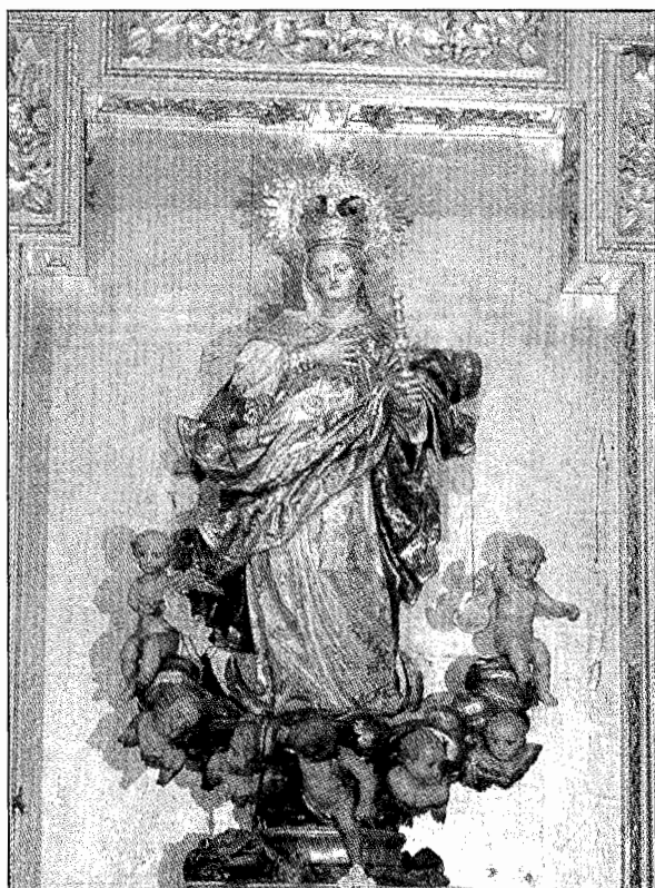
San Millán de Yuso. Asunción de la Sacristía.