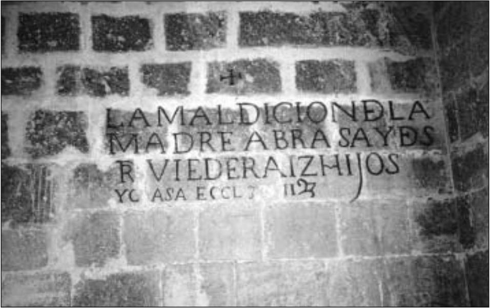
Figura 2.- Inscripción situada en la puerta sur de la iglesia parroquial de Treviño, antes de entrar a mano derecha.