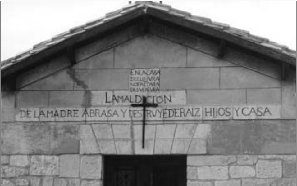
Figura 3.- Inscripciones pintadas en la fachada de la ermita de la Plaza del Ayuntamiento del pueblo de Bernedo.