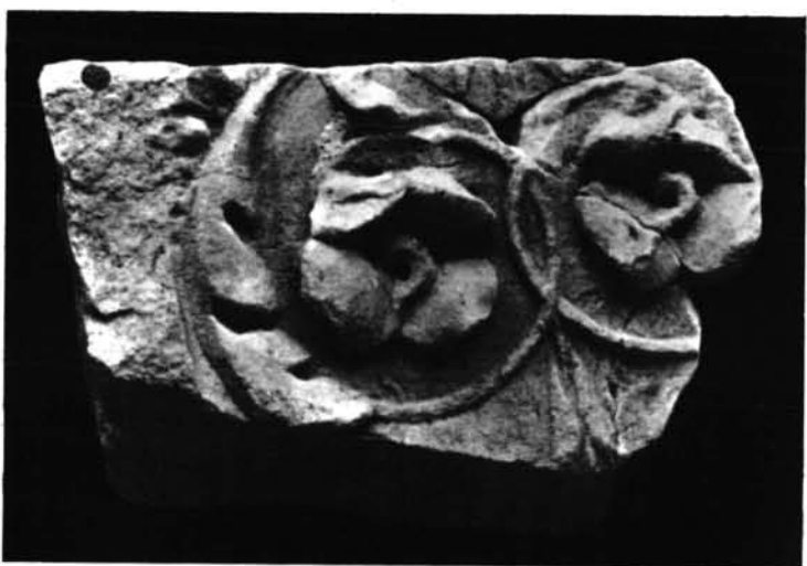
Capiteles corintizantes de La Alcudia: 1. Liriforme.—2. Doble S.—3. Con influjo del orden compuesto.—4. Con volutas entrelazadas.