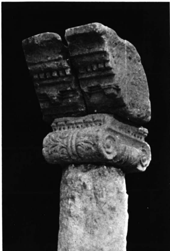
1. a y b. Capitel iónico de Jávea.—2. Capitel iónico de La Aludia