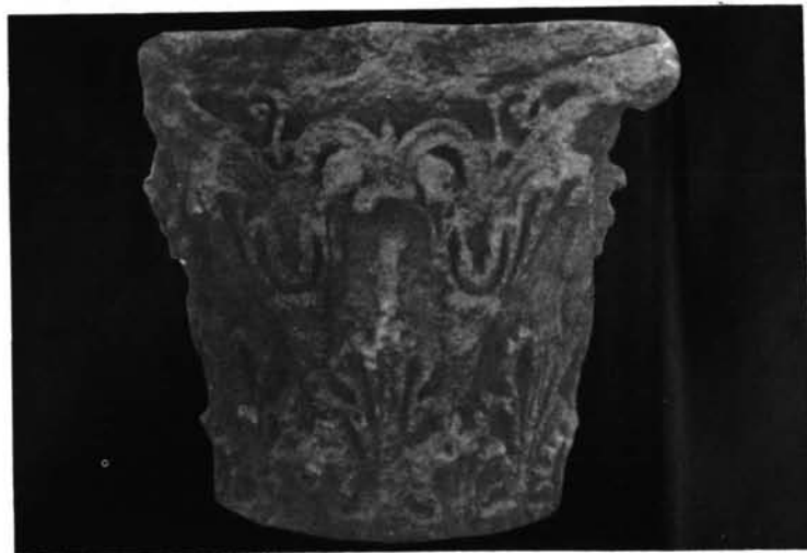
1 a 3. Capiteles toscanos de Jávea.—4. Capitel corintio de La Alcudia.