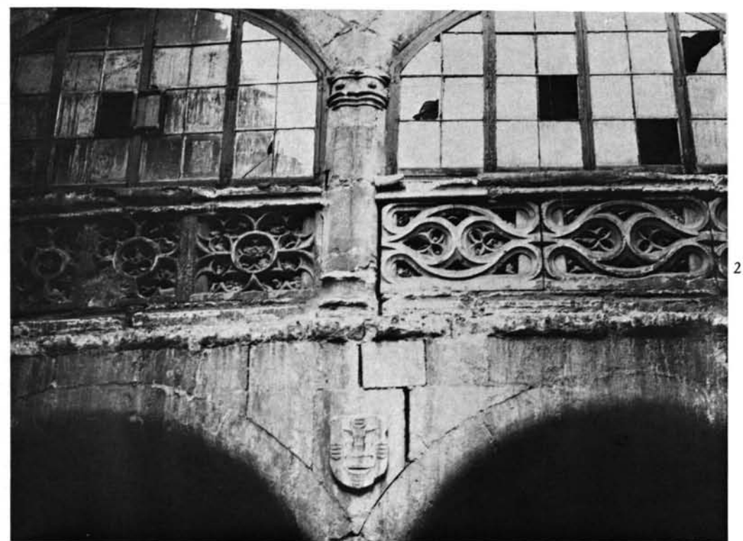
Valladolid. Casa de las Veneras: 1. Plano de Ventura Seco, de la zona donde se erigió la Casa. El número 95 corresponde a la Universidad; el 96 es el Colegio Mayor de Santa Cruz.—2. El patio tal como se hallaba.