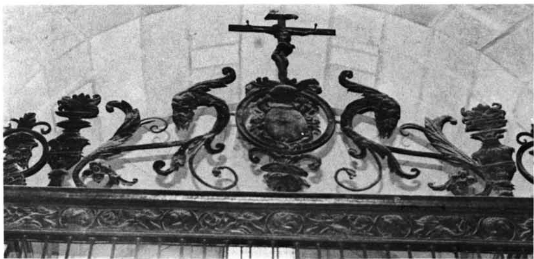
Torrelaguna. Iglesia parroquial: 1. Reja de la capilla de los Vélez.—2. Reja.—3. Detalle de la reja anterior.—4. Remate de una reja.