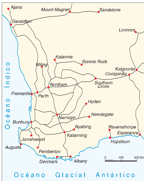
FIG. 5. La red de ferrocarriles en 1931.

A pesar de que el ritmo de construcción de ferrocarriles descendió a partir de 1917, el gobierno no quiso modificar su política general de colonización. La aprobación de la Enmienda a la Ley de Tierras ( Land Act Amendment Act 1917 ) significó un incremento de la demanda de tierras agrícolas, ya que ofrecía la posibilidad de que los colonos accedieran a la propiedad de la tierra sin efectuar pago alguno durante los primeros cinco años de trabajo. Esta enmienda fue importante para la expansión de la agricultura del estado en los años veinte y se sumaba a toda la legislación anteriormente aprobada. La situación fue correlativa a la subida de los precios del trigo y de la lana, cuyo montante casi se duplicó entre mediados de la década de 1910 y principios de la de 1920. La excelente coyuntura provocó una expansión de la agricultura extensiva, que se vio reforzada con una Ley de Asentamiento de Soldados Licenciados ( Discharged Soldiers Settlement Act 1918 ), bajo la cual soldados imperiales y australianos podían adquirir lotes agrarios y grandes propiedades. El alto precio de la lana y el trigo motivó que los soldados escogieran mayoritariamente el Wheatbelt, pues percibían que allí obtendrían rápidos beneficios 15 .