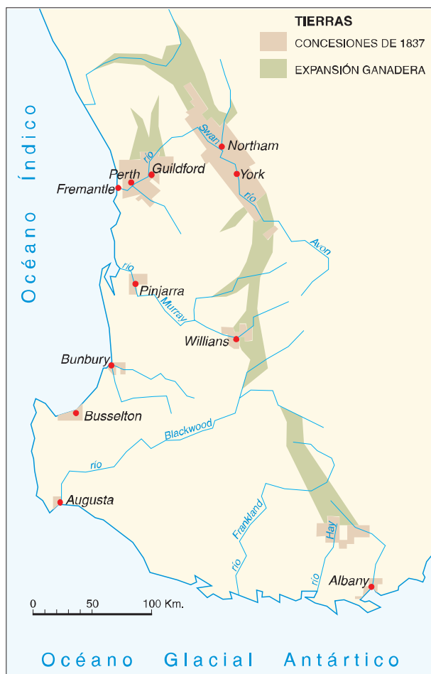
FIG. 2. Las tierras concedidas en 1837 y las primeras áreas de expansión ganadera.