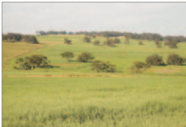
FIG. 6. Algunos paisajes del Wheatbelt de Australia Occidental (10/2003). (Página anterior, izquierda) Un campo de colza cerca de Katanning, estampa típica del Wheatbelt. (Página anterior, derecha) Granja abandonada en el condado de Wandering. (En esta página) Vista panorámica de trigales desde una colina en el condado de York, en el valle del Avon.

la mitad de la cual provenía de inversiones directamente relacionadas con el sector agrario). De todas formas, sí que hubo una cierta respuesta del gobierno estatal a esta crisis, que se plasmó en nueva legislación, concretamente en una Ley de Ajuste de la Deuda de los Campesinos ( Farmers Debt Adjustment Act 1931 ), que concedió una moratoria a las deudas contraídas. Esta ley se acompañó de programas de reconstrucción de la deuda gestionados por el Banco Agrario. Además, la ley permitía al estado introducir un subsidio al trabajo para emplear a agricultores en paro y subvencionar, indirectamente, el coste de la producción agraria. El gobierno de la Commonwealth también intervino durante 1931 devaluando la moneda, medida que mejoró la capacidad de Australia para la exportación. Asimismo, el gobierno federal ayudó a las explotaciones entre 1931 y 1936 mediante la provisión de subsidios, subvenciones e incentivos para el mantenimiento de los precios y créditos directos a los agricultores y ganaderos.