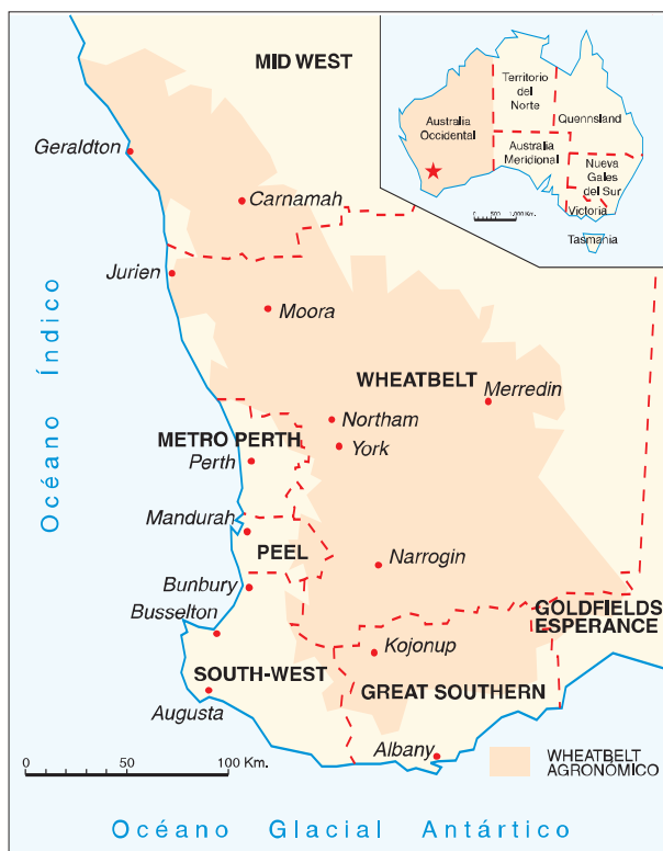
FIG. 1. Australia y la región agraria del Wheatbelt con la división administrativa regional actual.

En 1829, se establecía la colonia de Australia Occidental, con lo que el Reino Unido tomaba oficialmente posesión del último tercio del continente, hasta entonces