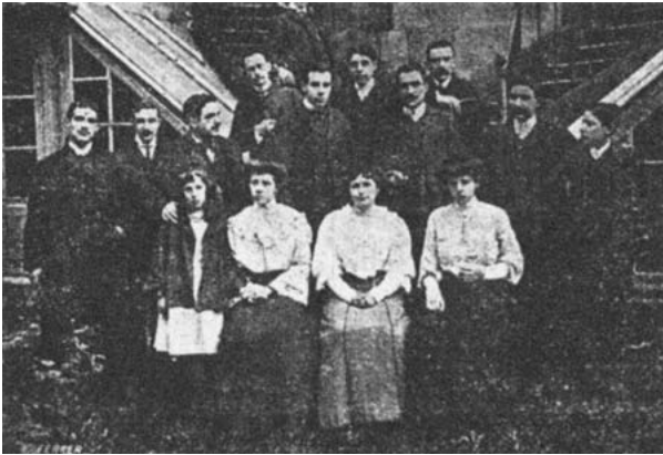
Actores e actrices da Escola Rexional de Declamación.

Segundo Francisco Pillado Mayor no seu libro O teatro de Manuel LUGRÍS FREIRE para LUGRÍS FREIRE, o teatro "entre outras cousas, constitue un importante vehículo ideolóxico e propagandístico. A ponte é a primeira obra de teatro social en lingua galega.