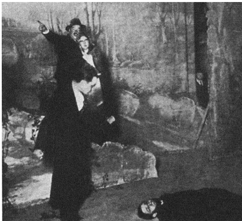
Escena de A Ponte.

A ponte está construída en función do seu final: o asasinato do Vinculeiro. O conflito da obra non é máis ca unha revisión do clásico tema da loita do Ben contra o Mal, un tema máis ca visto ó longo da historia do teatro e da arte en xeral.