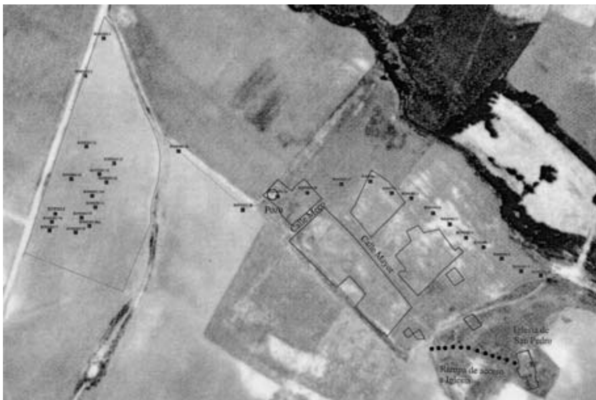
Fig. 2. Fotografía aérea con la poligonación del despoblado y la ubicación de los sondeos arqueológicos.

presente actuación, y la casa de Juliana, en la intersección del camino de Fresno del Torote con la carretera de Alcalá (fig. 3). Esta última es una casa de corrales abiertos, uno estructurado con la edificación y el otro con cercas; tiene uso predominante como tenada de ganado lanar. Con posterioridad, probablemente a finales del XIX o principios del XX, se construyeron algunas casas con estas características. Una de ellas sería la casa del Ángel, en la carretera de Alcalá. Esta presenta una tipología sencilla en la que predomina la cerca en la formación del perímetro. En la parcela de la EDAR se han localizado los restos de una vivienda con esta tipología emplazada en el camino que se dirigía a Meco.