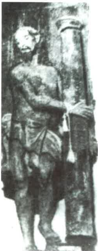
Fotografía N° 1 Antigua fotografía de Cristo atado a la columna. Osera.