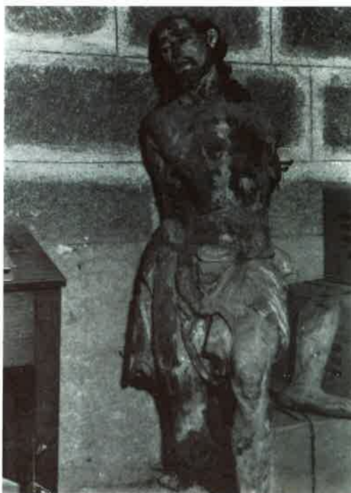
Fotografía N° 2. Cristo atado a la columna. Osera.