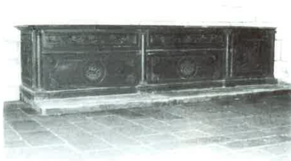
Fotografía N° 4. Cajones. Monasterio de Osera.