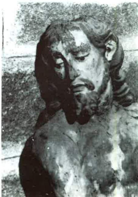
Fotografía N° 3. Detalle de Cristo atado a la columna. Osera.