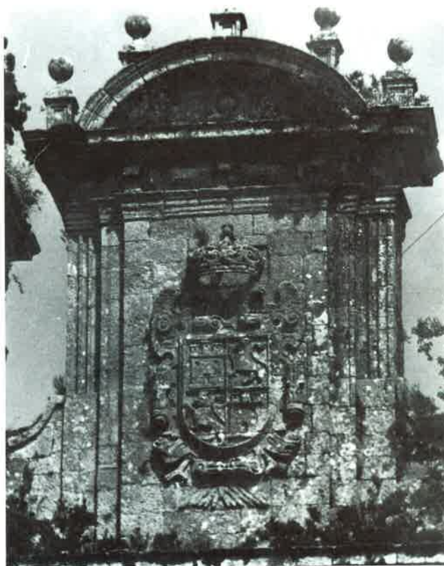
Fotografía N° 5. Escudo entre las torres. Osera.