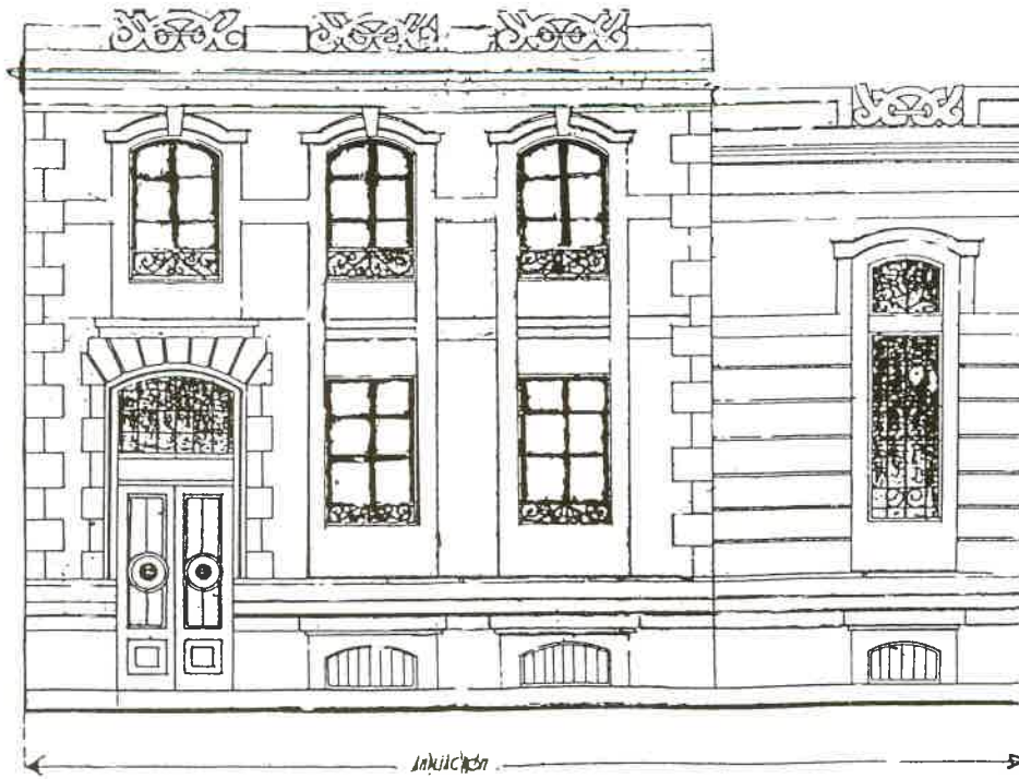
Fachada ampliada no ano 1940. Según dirección do arquitecto ourensano D. Manuel Conde Fidalgo