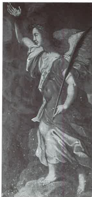
Fotos 6 y 7. Pinturas del Retablo Mayor del Santuario de Villamayor del Valle (Verín). Carlos Suárez. 1609.