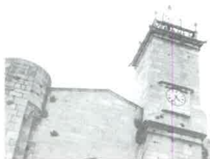
Foto 12. Reloj de la Catedral de Ourense.