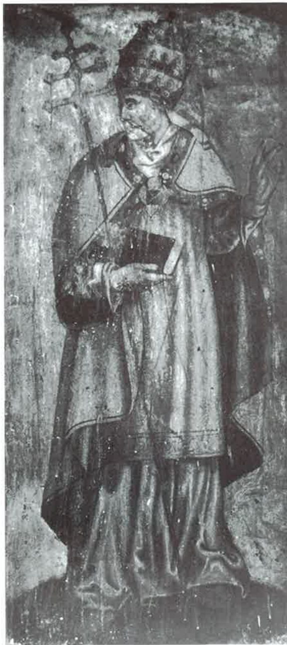
Foto 9. Pintura del Retablo Mayor del Santuario de Villamayor del Valle (Verín). Carlos Suárez. 1609.