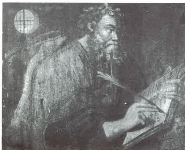
Foto 8. Pintura del Retablo Mayor del Santuario de Villamayor del Valle (Verín). Carlos Suárez. 1609.