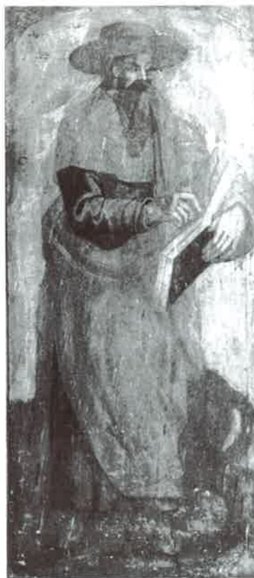
Fotos 4 y 5. Pinturas del Retablo Mayor del Santuario de Villamayor del Valle (Verín). Carlos Suárez. 1609.