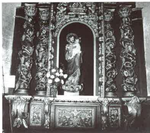
Foto 3. Retablo colateral en la Iglesia de la Santísima Trinidad (Ourense). Castro Canseco. 1700.