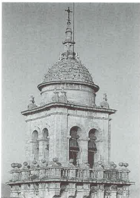
Foto 10. Torre de las campanas de la Catedral de Ourense.