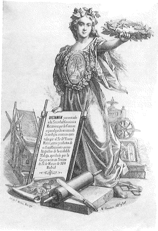
Fig. 3. Litografía realizada por el establecimiento de D. Fausto Muñoz Madueño en 1874.