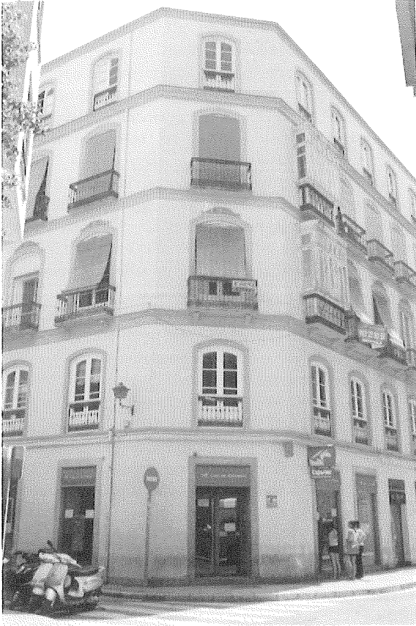
Fig. 2. Edificio nº 4 de calle Méndez Núñez, lugar donde se ubicó el establecimiento y la residencia de D. Fausto Muñoz Madueño.