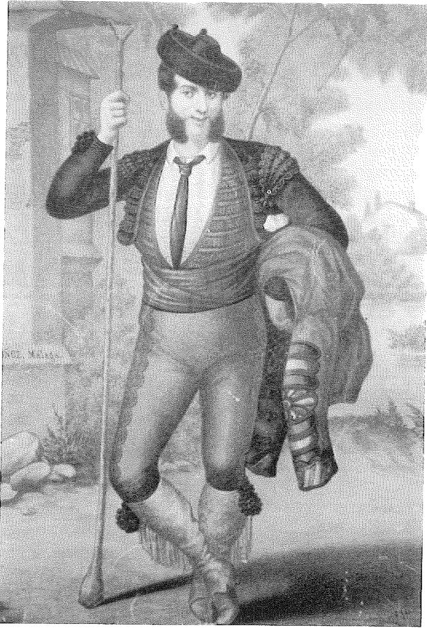
Fig. 4. Litografía realizada por el establecimiento de D. Fausto Muñoz Madueño.