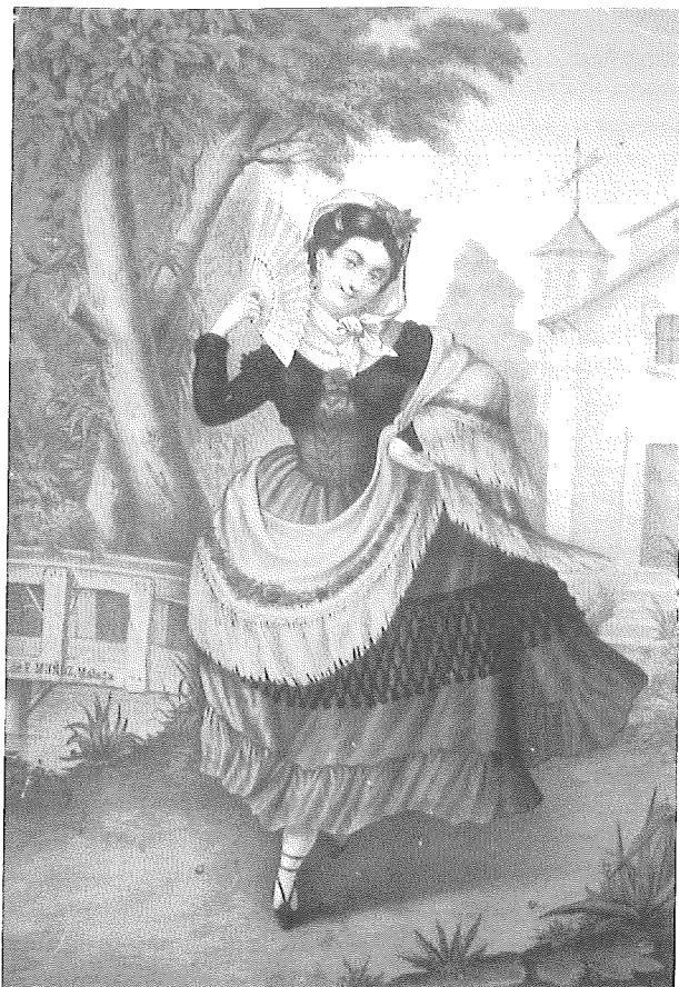
Fig. 5. Litografía realizada por el establecimiento de D. Fausto Muñoz Madueño.