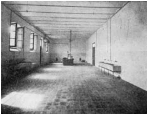
La amplia y modernísima cocina, otro departamento modelo.

En El Popular del día 14 de octubre, se publicó una entrevista con José Estellés, director general de prisiones; en ésta se comentaban diversas actuaciones que serían llevada a cabo próximamente en relación con la Ley de vagos, amnistía, gastos de locomoción a los funcionarios de la prisión, dada la lejanía del centro de la nueva cárcel, y también aclaraba que la capacidad de la prisión, en un primer proyecto, era para 150 plazas. Más tarde fue rectificado para una estancia de 300 reclusos, y entonces podía afirmar que podría dar cabida a 400 reos. En aquel año de 1933, la antigua prisión tenía 229 plazas, más 14 presos políticos y 2 reclusas. Al preguntarle el periodista cuándo podrían trasladarse los presos a la nueva cárcel, el Sr. Estellés aclaró que había que terminar aún algunos detalles complementarios en la nueva cárcel: instalación de la luz, mobiliario, etc.; por lo que creía que el traslado podría efectuarse en el plazo de dos meses 9 . También las revistas malagueñas se hicieron eco de la inauguración de la nueva prisión, con fotos del interior del inmueble 10 .