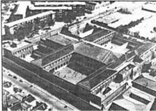
Vista aérea de la cárcel situada en Carranque.

como emplazamiento de una nueva cárcel. Uno de estos terrenos es el que parecía, a juicio de todos los concurrentes a dicha visita, reunía mejores condiciones, era el situado a la izquierda de la carretera de Cuesta del Espino a Málaga, pasado el puesto sanitario. Esteve señalaba en rojo en el plano que presentaba -realizado por otro arquitecto encargado de formular el proyecto-, el sitio dónde a su parecer debía situarse la nueva prisión; ésta tenía una superficie de 14.175 m 2 , y la parcela un total de 21.608 m 2 .