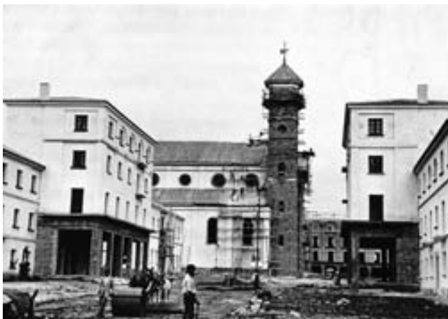
Carranque en obras. Acceso lateral.

La respuesta del Ministerio llegó poco después: el 2 de abril de 1928 una Real Orden dejaba sin efecto la anterior del 21 de enero último, y aceptaba el nuevo solar ofrecido. En la Comisión municipal de 7 de abril se leyó esta Real Orden, y se acordó pasase al Ayuntamiento Pleno para su sanción 1 .