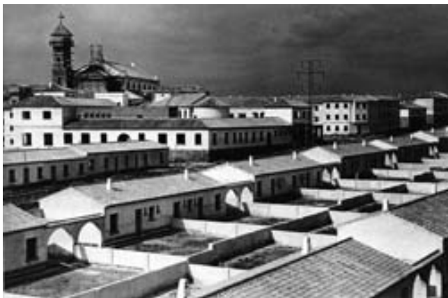
Carranque en obras. Vista general.

El precio de la venta de estos terrenos fue de 32.412 pesetas.