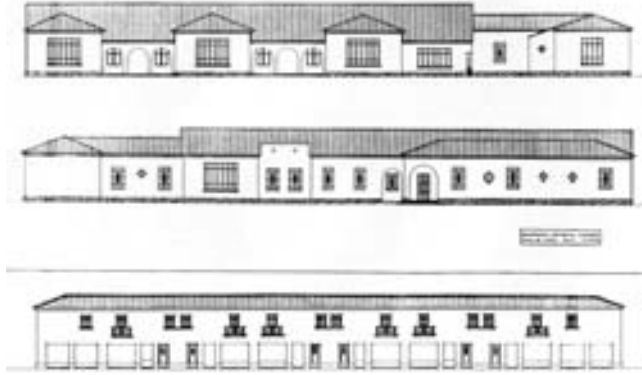
Barriada de Carranque. Modelo de casas de estilo rural.

En la sesión de Cabildo del día 28 de julio de 1958 se acordó que el Ayuntamiento se hiciese cargo, con carácter provisional, de la explotación del Mercado de Abastos de la barriada del Generalísimo Franco (Carranque), procediéndose a su apertura. A continuación se leyó una Moción del Tte. Alcalde Delegado de Mercados, dando las normas y ordenanzas con sus tarifas correspondientes. En dicha Moción, se decía que consideraba prematuro proceder a la inauguración del mercado por no estar totalmente habilitada la barriada, faltando muchas viviendas por adjudicar, y otras muchas en construcción. Pese a ello, consideraba que se podía proceder a la subasta de las casetas y puestos del referido mercado. Con ello se pretendía quitar los actuales “puestecillos” situados en algunos lugares, y las tiendas que existían en los pisos particulares, sin permiso alguno, y que eran los que hasta entonces abastecían al vecindario 17 .