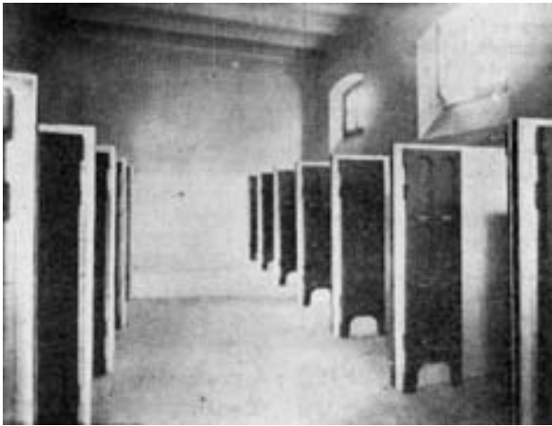
La gran sala de duchas es otro de los departamentos que más llaman la atención.

En la sesión de Cabildo de 27 de septiembre de 1971 se acordó realizar las obras de adaptación en el “Instituto Geriátrico de Mujeres”, a la mayor celeridad posible, a fin de