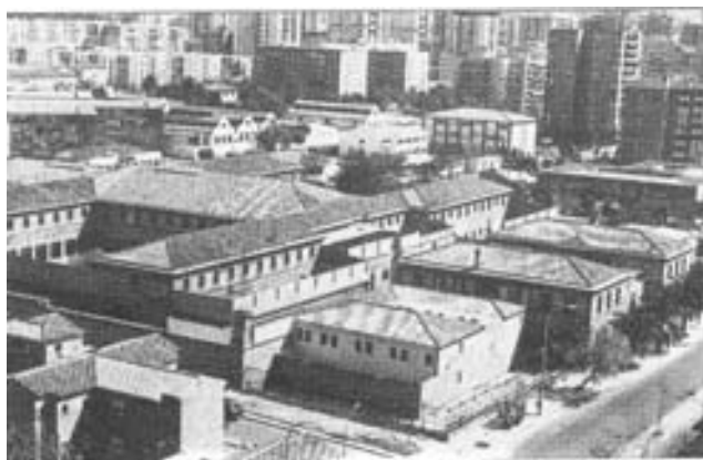
Cárcer en las inmediaciones de Carranque.

En la Comisión Permanente celebrada el 26 de enero de 1928, se leyó un Real Decreto, fechado el 21 de enero, el cual decía que visto el plano de ensanche de la ciudad, y el solar señalado en el mismo, con una superficie de 16.072 m 2 , que había acordado ceder el Ayuntamiento al Estado para construir la nueva prisión provincial, S. M. el Rey se había dignado disponer se aceptase el mencionado terreno, designando al presidente de la Audiencia para que