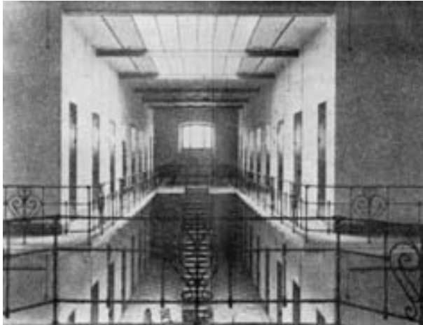
La galería central del edificio construida con arreglo a las más modernas normas penitenciarias.

En la sesión de Cabildo de 27 de septiembre de 1971 se acordó realizar las obras de adaptación en el “Instituto Geriátrico de Mujeres”, a la mayor celeridad posible, a fin de