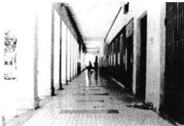
Barriada de Carranque. Aspecto de las soportales de la Plaza de Pío XII.

Para comenzar las obras se constituyó, en 1949, la Constructora Benéfica del Sagrado Corazón de Jesús, gracias al patrocinio del obispo Ángel Herrera Oria. Por un Decreto de dicho