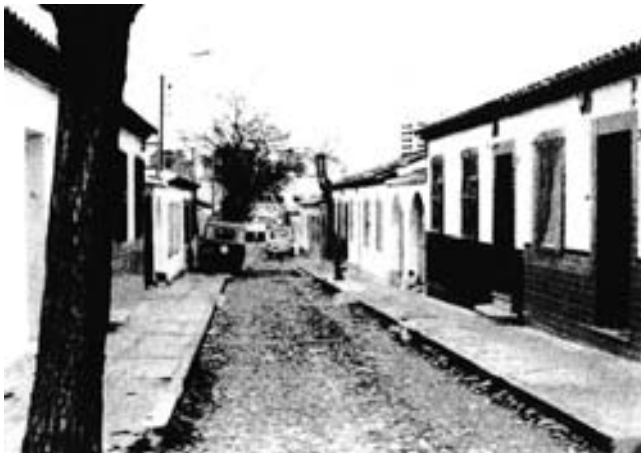
Barriada de Carranque. Viviendas unifamiliares, modelo estilo rural.

La propia dinámica del barrio generó un nuevo centro nuclear: el situado en torno al mercado, donde se desarrolló enormemente el comercio; se creó una doble centralidad, rompiendo así con las previsiones iniciales de los estamentos oficiales 20 .