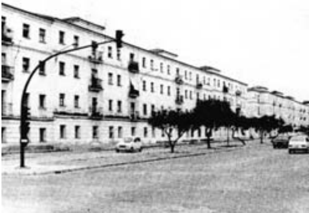
Barriada de Carranque. Aspecto de fachada principal.