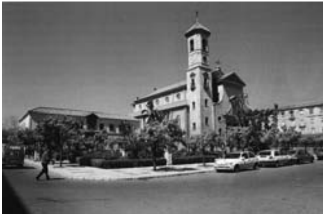
Iglesia de San José Obrero, situada en la Plaza de Pío XII (Carranque).

Atendió las peticiones de varios reos, probó el rancho, y finalmente dijo que la cárcel de Málaga tenía muchos defectos, siendo el más importante la falta de celdas o un departamento que debía estar destinado para los que no eran profesionales del delito.