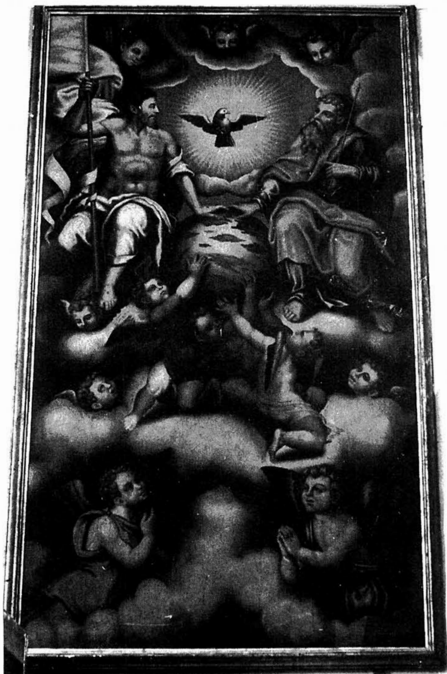
Lám. 3 Anónimo: "Trinidad", Murcia, Catedral, Capilla de San Antonio o del Corpus