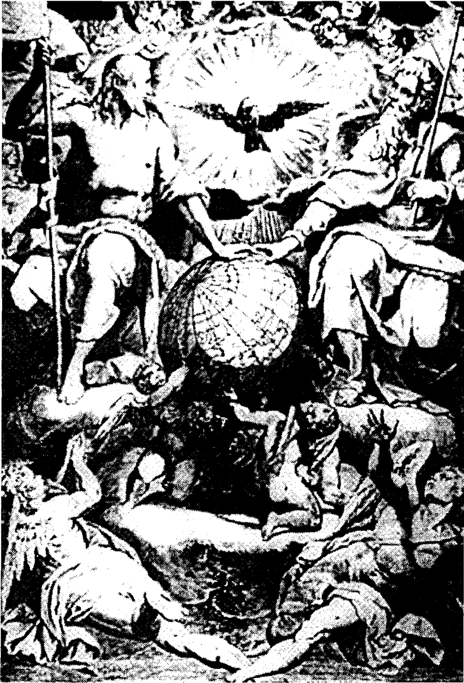
Lám. 1 "La Trinidad", composición de Oracio Samacchini en estampa grabada por Doménico Tibaldi (Pérez Sánchez, EPHIALTE, IV 1994, p. 71, Fig. 15)