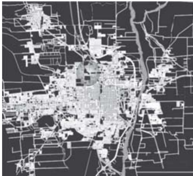
FIGURA 2: ZONIFICACIÓN DE BARRIOS JUAN PABLO II, ALBERDI NORTE Y JUAN XXIII EN PLANO ASENTAMIENTOS ÁREA METROPOLITANA SMT

(Fuente. Instituto Provincial de Vivienda, 2003).