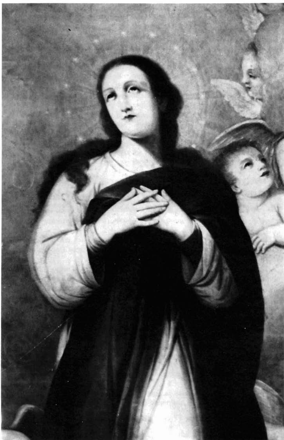
Figura 3. Inmaculada. Detalle.