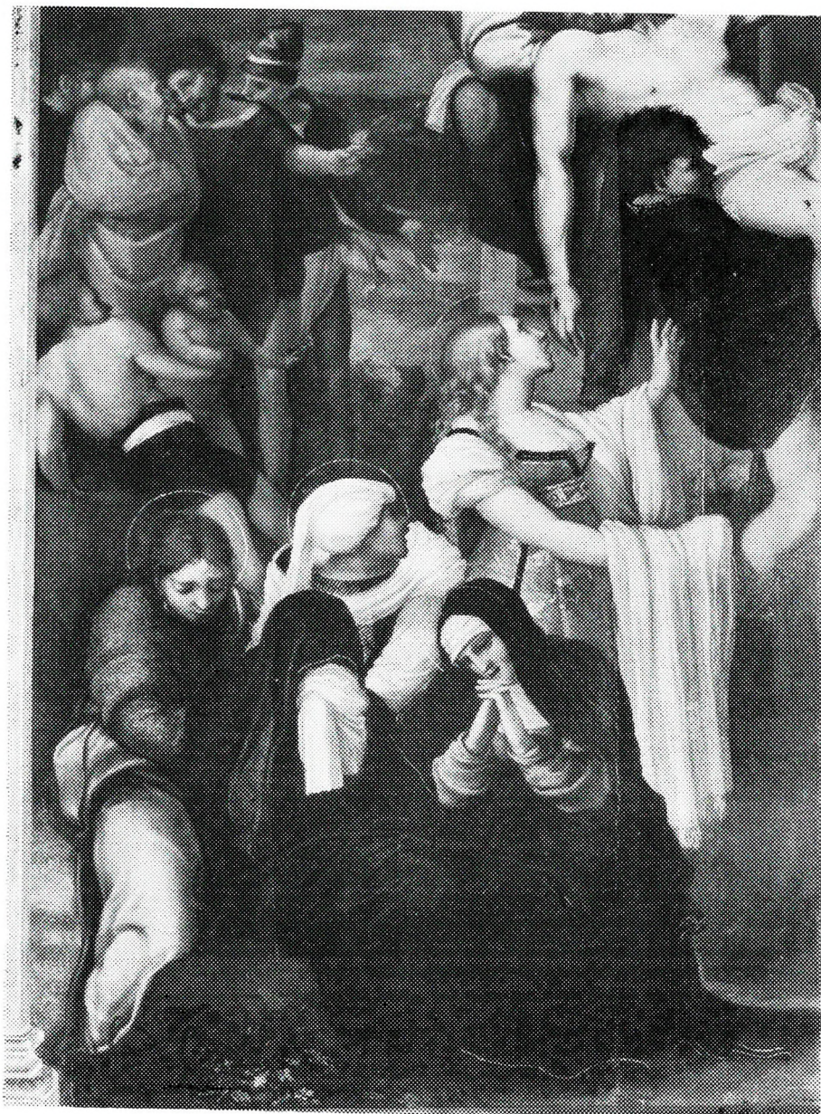
“Descendimiento” (Detalle). Pedro Machuca. (M. del Prado)