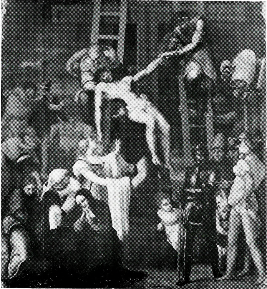
“Descendimiento”. (Pedro Mochuca) M. del Prado.