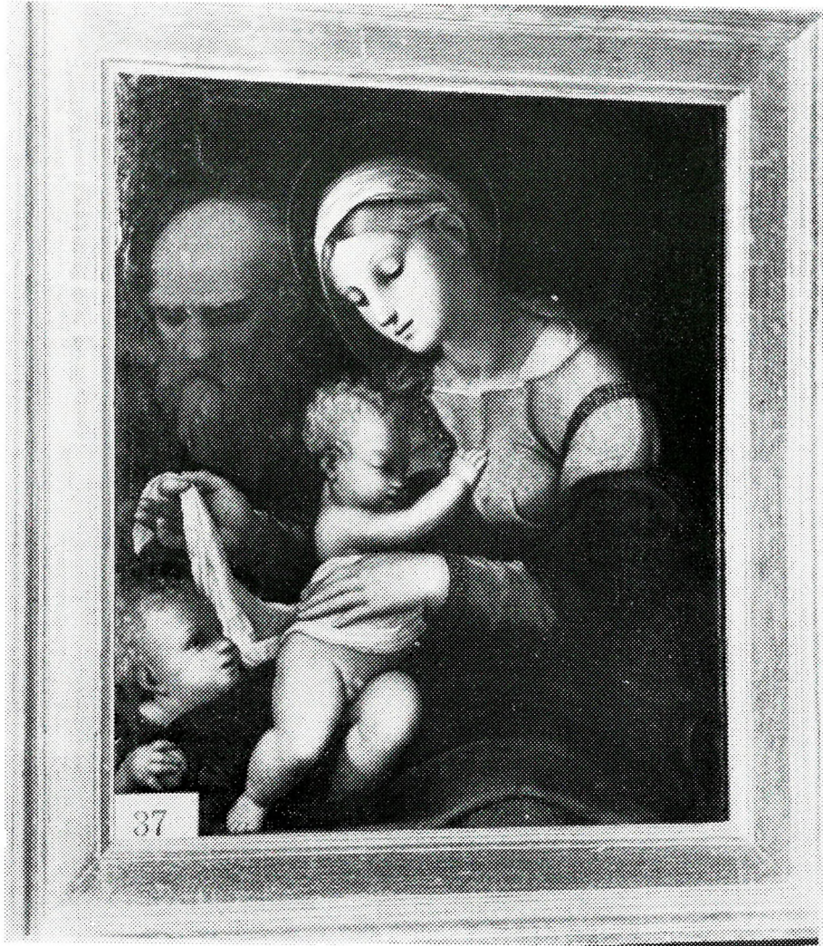
Sagrada Familia con San Juanito. (Pedro Machuca) Museo S. I. Catedral.