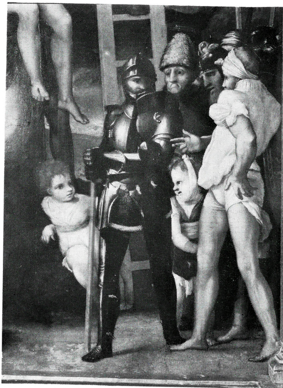
“Descendimiento” (Detalle). Pedro Machuca. (M. del Prado)