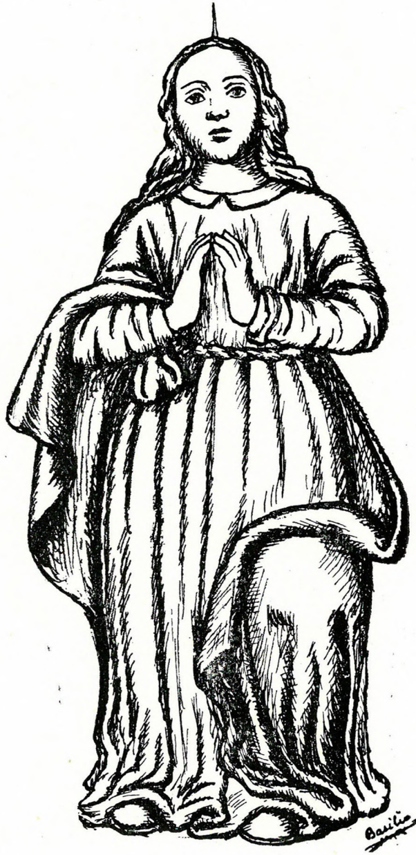
Imagen de piedra de la Virgen de la Gufa