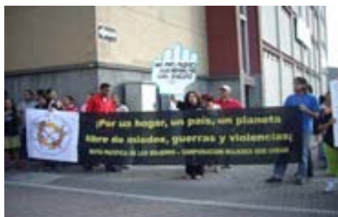
28 de febrero 2005, Martes Negro

En el mes de agosto de 2000, la Organización Femenina Popular y la Ruta Pacífica de las Mujeres acordaron vestirse de negro y protestar en silencio contra el conflicto armado en Colombia, las guerras y las violencias. Unidas al movimiento planetario “Mujeres de negro por la vida y contra la guerra”, el último martes de cada mes se realiza una concentración silenciosa en muchas ciudades del mundo. En la ciudad de Medellín los Martes de Negro suceden a los pies de la parada de la estación del metro Parque Berrío Allí recuerdan con pancartas lo siguiente: