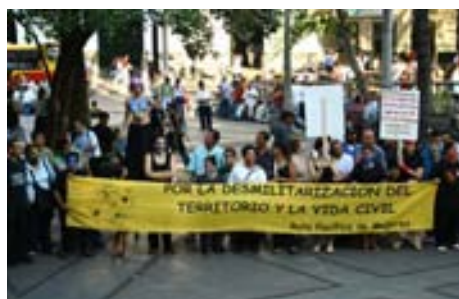
28 de febrero 2005, Martes de de Negro