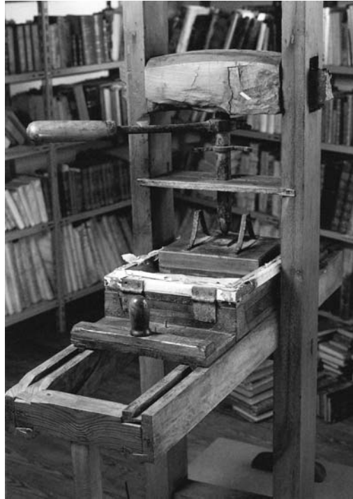
Primera imprenta de La Palma.

extraídos de cada uno de los impresos que se describen en la mentada obra, esbozando en las pocas páginas que consagra a esta ciudad un retrato muy superficial de las primeras oficinas impresoras que surgieron al socaire del incipiente desarrollo industrial de nuestro país 11 . Con posterioridad, es necesario citar la reseña del mencionado Régulo Pérez a la Tipografía canaria de Vizcaya 12 , la monografía de Hernández Suárez 13 , un trabajo de