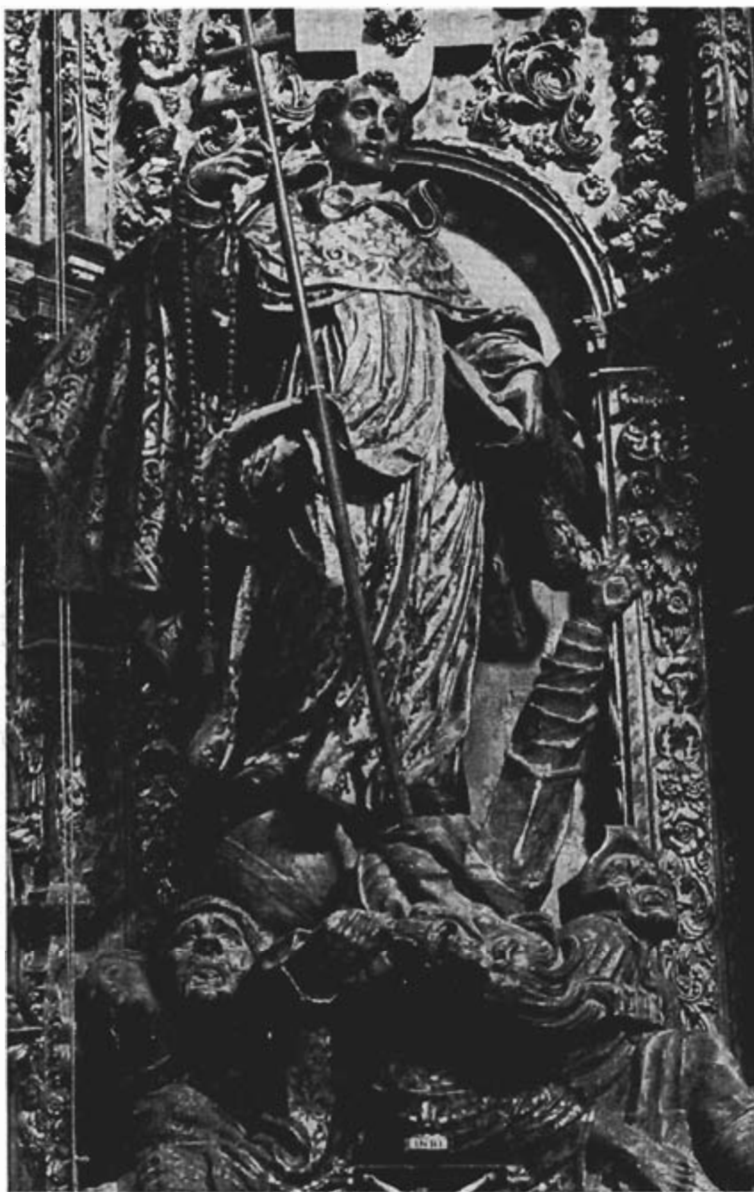
Retablo de Santo Domingo. El grupo de imágenes de la parte inferior muestra el barroquismo del escultor