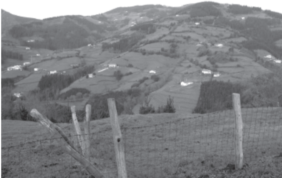
Foto 2. El caserío es una pieza clave en la definición del paisaje agrario

pastos comunales o de enterramiento en la sepultura familiar) reservados en exclusiva a los que viven bajo el techo del caserío.