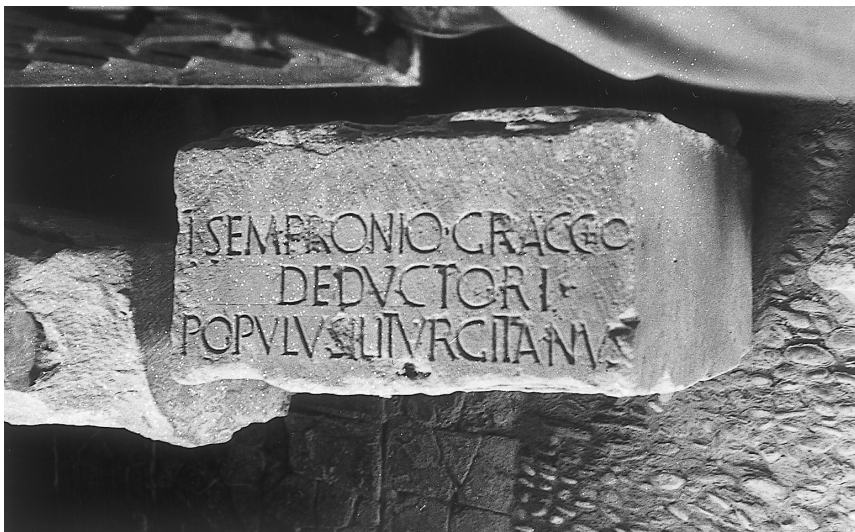
Inscripción T. Sempronio Graco. Mengíbar.

Fue encontrada en el cortijo de las Torres (Maquiz) en 1950. Actualmente se encuentra en la Casa-Palacio de la familia La Chica Casinello de Mengíbar. Es un bloque de piedra caliza parda amarillenta de 32 x 59 x 70 con letras capitales cuadradas.