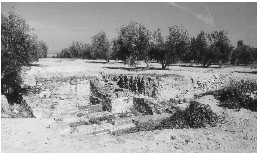
Iliturgi. Cerro Maquiz. Restos de un templo romano.

Plinio en su Naturalis Historia dice: «Dentro del Conventus Cordubensis y cerca del mismo río (Betis) álzase Ossigi , a la que dan el epíteto de Latonium ; Iliturgi , que apellidan Forum Iulium .....» (1).