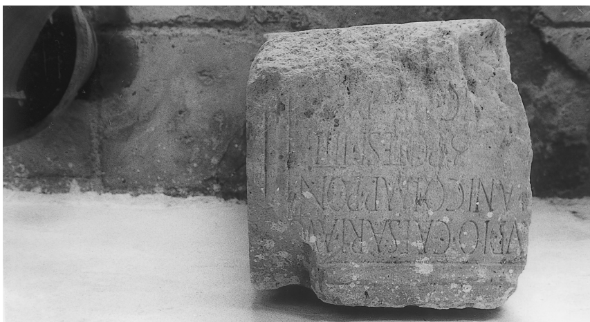
Mengíbar. Claudio Caesari.

Fragmento de un posible pedestal del que sólo se conserva la parte superior de la piedra y ésta muy deteriorada, aunque las letras que contiene están bien conservadas. Tiene 40 x 90 x 38 y le faltan la esquina derecha superior y la izquierda inferior. Fue encontrado en Las Torres de Maquiz por los años cuarenta. Algunos lo han considerado miliario, pero por la forma cuadrangular parece un fragmento de algún pedestal de una estatua. Del s. I.