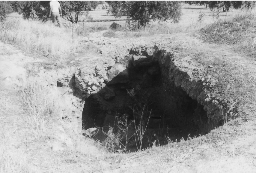
Iliturgi. Cerro Maquiz. Restos de construcción romana.