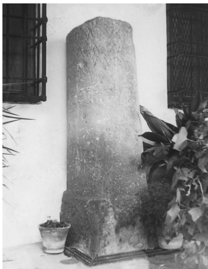
Miliario del Cerro Maquiz (Mengíbar).

Las ocho millas de 1481 m. dan los cerca de doce kms. que hay desde Castulo al Cerro de Maquiz, pasando el vado por debajo de la confluencia del Guadalimar con el Guadalquivir.