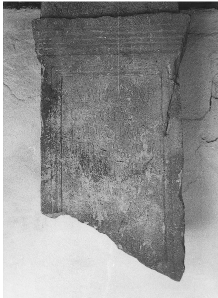
S. Quintio Vitali. Mengíbar.

Y una tercera que también menciona el origen iliturgitano de la difunta. Apareció en el Cerro Maquiz y actualmente se encuentra en el cercano pueblo de Villargordo en una casa particular. Es de mármol blanco y mide 24 x 32 x 5. Las letras capitales actuarias. S. II.