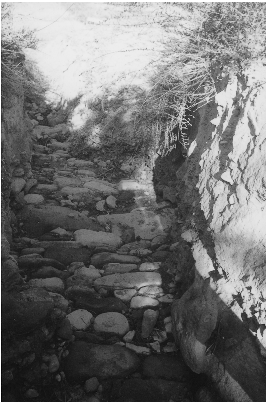
Calzada romana. Mengibar.