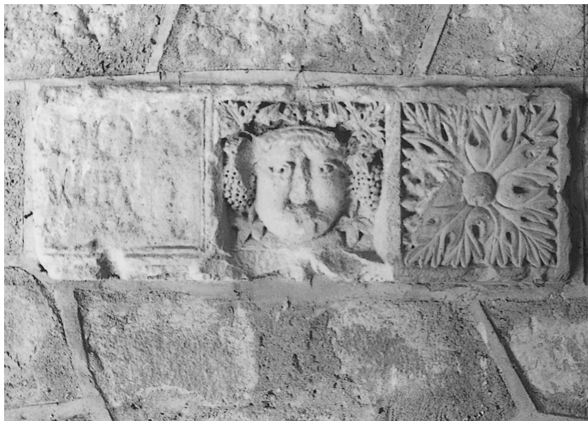
Cortijo Maquiz. Relieve.

9. 7, 43. Estela sepulcral o cipo o mojón de límites de piedra arenisca de 130 x 53 x 38 encontrada en Las Torres de Maquiz y conservada igualmente en la casa de los Sres. La Chica Casinello. Letras capitales cuadradas. Del s. I.