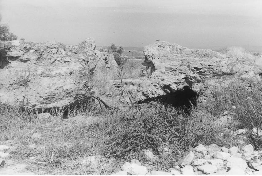
Iliturgi. Cerro Maquiz. Restos de construcción romana.