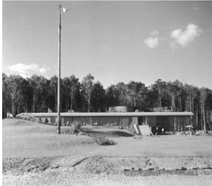
Foto. 5. Hotel La Solana del Mar. Maldonado, Uruguay. Arquitecto Antonio Bonet, 1947.

Pero la urbanística moderna olvidó pronto su propuesta figurativa para el turismo, y, para retener consigo la imagen de la naturaleza, fue poco a poco incorporando modelos propios de la ciudad, como los de la ciudad jardín . La fuerza figurativa original basada en la confrontación paisajística activa entre arquitectura y geografía se diluyó pronto en una piadosa recuperación de la jardinería. Las piezas urbanas, al principio definidas por su diferenciación formal, identificables y diferenciadas, separadas de los elementos geográficos, se disolvieron luego en un espacio urbano unitario, extensivo y continuo, tapizante del territorio.