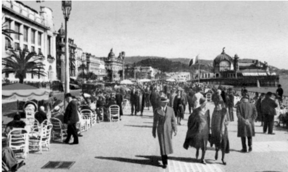
Foto 2. Niza. El Paseo de los Ingleses en la segunda década del siglo XX.

obras públicas para representar la sociedad moderna. Los lugares famosos del turismo son el testimonio de la diversidad de formas, urbanas y geográficas, con que se ha expresado el ideal cosmopolita: los paseos marítimos de Brighton, Niza o Copacabana, las ciudades de vacaciones de las rivieras francesa e italiana, Mallorca y Marbella agrícolas de los años sesenta, la condición volcánica de La Orotava o Taormina, París o Portofino, son objeto de deseo en cuanto figuraciones del cosmopolitanismo transgresor : liberación de códigos impuestos, impremeditación y azar en las relaciones, valor de los márgenes... Lo insólito de la urbanización turística original es que mostró cómo los lugares para el turismo pueden concebirse y construirse con las formas y atributos cosmopolitas de las metrópolis sin alterar la condición geográfica del lugar, esto es, reuniendo en el proyecto memoria y transformación, continuidad y cambio.