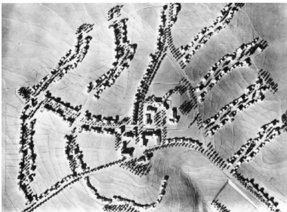
Foto 6. Maqueta del poblado de vacaciones La Martella, en Manera (Italia). Arquitecto Ludovico Quaroni, 1950.

La consolidación de nuestras economías turísticas regionales en España como economías inmobiliarias no tiene otro destino posible que la hecatombe ambiental y geográfica. Otra posibilidad, la detención súbita del proceso y la paralización de la actividad de urbanización-edificación, conduciría al colapso de algunas economías regionales, en un país cuya balanza de pagos la equilibra el turismo, y las gentes de las áreas turísticas no ven otro porvenir económico y laboral que el ofrecido por la actividad inmobiliaria. Por eso nadie busca alternativas