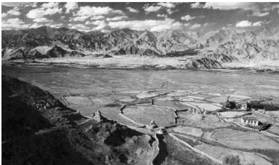
Foto 4. La geografía es el palimpsesto donde se escribe la arquitectura.

No he encontrado un texto mejor con el que explicar elemental y brevemente la noción de geografía como naturaleza historizada, que es la que debe servir de fundamento a la construcción de una urbanística actual, y a la revisión epistemológica de las ideas que han perdido o no han alcanzado significado, como las de paisaje y sostenibilidad.