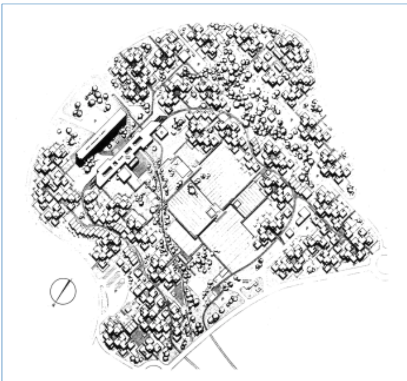
Foto 3. Plan turístico en Punta Ala (Italia). Arquitectos Quaroni, Maestro y Sonzogni, 1960.

El impulso subjetivo que mueve al turista a visitar otros lugares nace con las fantasías de liberación de normas coercitivas, y de regeneración. Una y otra aspiración tienen sus leyes: no se trata de emanciparse de toda norma, sino de experimentar que son posibles otras (otras culturas, otras experiencias). Tampoco se trata de rehacerse como sujeto; la regeneración se entiende normalmente como recuperación de la fuerza física, de la salud, o también referida al propio espíritu, atenta a la subjetividad, como queriendo observarse a sí mismo desde otro punto de vista. Son aspiraciones muy urbanas. Los turistas proceden de un ambiente urbano y requieren ser recibidos también en una cultura urbana, en espacios conscientemente conformados. Sin embargo los lugares del turismo no pueden explicarse si nos limitamos al punto de