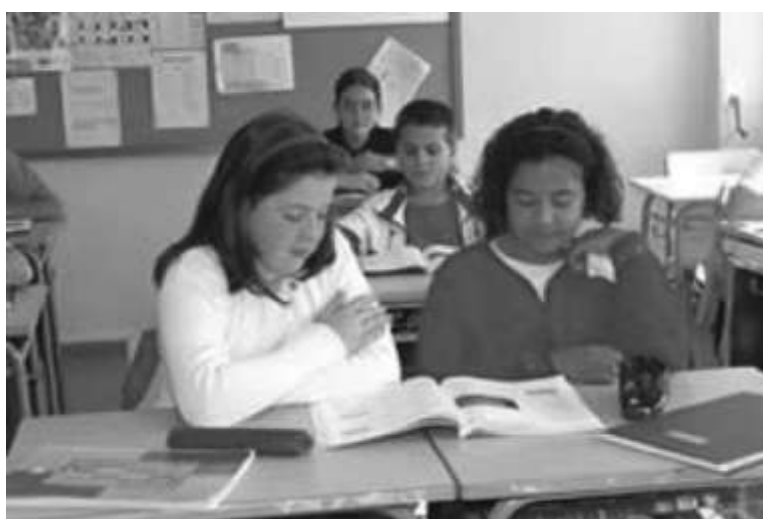
La mezcla de culturas –interculturalidad- es imprescindible para la integración

Una aplicación directa de esta idea sería la de tratar de dispersar en varios colegios, entre los financiados con fondos públicos, a los alumnos inmigrantes de varias procedencias para evitar que en sus relaciones cotidianas mantengan las estructuras de relación que ya tenían antes de llegar y así favorecer la mezcla cultural que dé lugar a algo nuevo, manteniendo, eso sí, la primacía de la cultura local que les acoge.