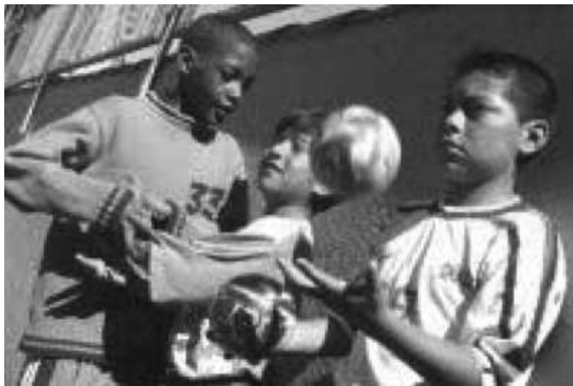
La educación intercultural no sólo genera problemas, también riqueza cultural y material.

No se trata de extirparles su propia cultura, ya que el aporte de savia nueva siempre ha fertilizado las culturas decadentes, como nuestra actual cultura occidental: cultura consumista, pesimista y superficial que ya no se aprecia a sí misma hasta el punto de que ya no nos molestamos ni en tener hijos con los que compartir nuestros bienes y que continúen con nuestras tradiciones y valores (¿falta de confianza cultural?). Se trata de que puedan conocer bien nuestra cultura, de que puedan participar en nuestras fiestas como algo suyo, de que puedan disfrutar con nuestros autores, ya hablemos de arte, literatura, música..., y de que su venida a nuestro país nos descubra también otra forma de ver la vida, en algunos aspectos con valores que hemos perdido como el aprecio por la familia, el valor de los hijos, con mucha frecuencia la capacidad de sacrificio que nuestro bienestar ha adormecido... y de que ellos descubran otros valores que nos ha costado siglos arraigar en nuestra sociedad como la igualdad de la mujer y el respeto por el derecho.