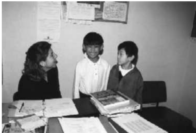
Las clases reducidas son siempre imprescindibles a los recién llegados para una adecuada integración

Los argumentos que se aducen para oponerse a esto son que, por una parte, son los mismos inmigrantes los que escogen esos colegios públicos de sus propios barrios para sus hijos, y que no somos nosotros los que debemos cambiar sus decisiones. En primer lugar, eligen esos centros porque suelen ser los únicos que existen en sus barrios, y eso tiene fácil solución: habilitar rutas de autobuses (gratuitas) idénticas a las miles de las existentes actualmente para traer a los alumnos de los colegios privados que viven en los nuevos barrios alejados de clase media o media-alta y que acuden diariamente a colegios céntricos porque, en muchos casos, se matricularon en la cercana casa de sus abuelos. Por otra parte se dice que el nivel educativo de estos chicos inmigrantes es muy bajo y, excepto los hispanoamericanos, desconocen el idioma y que por eso no se encontrarían bien en un entorno educativo cuyo nivel les es imposible alcanzar. Eso también ocurre en muchos centros públicos y, aunque admito que no es fácil lograr alcanzar el nivel medio de un centro español en muchos casos (aunque cada vez lo es más dado el bajón en el nivel educativo producido por la LOGSE), eso se palia con clases de refuerzo en grupos muy pequeños que son impartidas normalmente por profesores extra con formación específica para ello. Estos profesores siempre son escasos y suplen con un esfuerzo ímprobo la falta de tiempo y a veces de formación específica para abordar ciertos problemas.