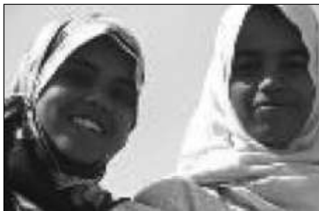
El velo ¿símbolo de identidad o de sumisión?

En Francia, desde el pasado curso 2004-2005 quedaron proscritos los «signos religiosos ostensibles, es decir, los que manifiesten ostensiblemente la pertenencia religiosa de los alumnos. Por si quedasen dudas, la exposición de motivos precisa que se refiere al velo islámico, sea cual sea el nombre que se le dé, o a la kippá 2 judía o también a una cruz de dimensiones excesivas» 3 .