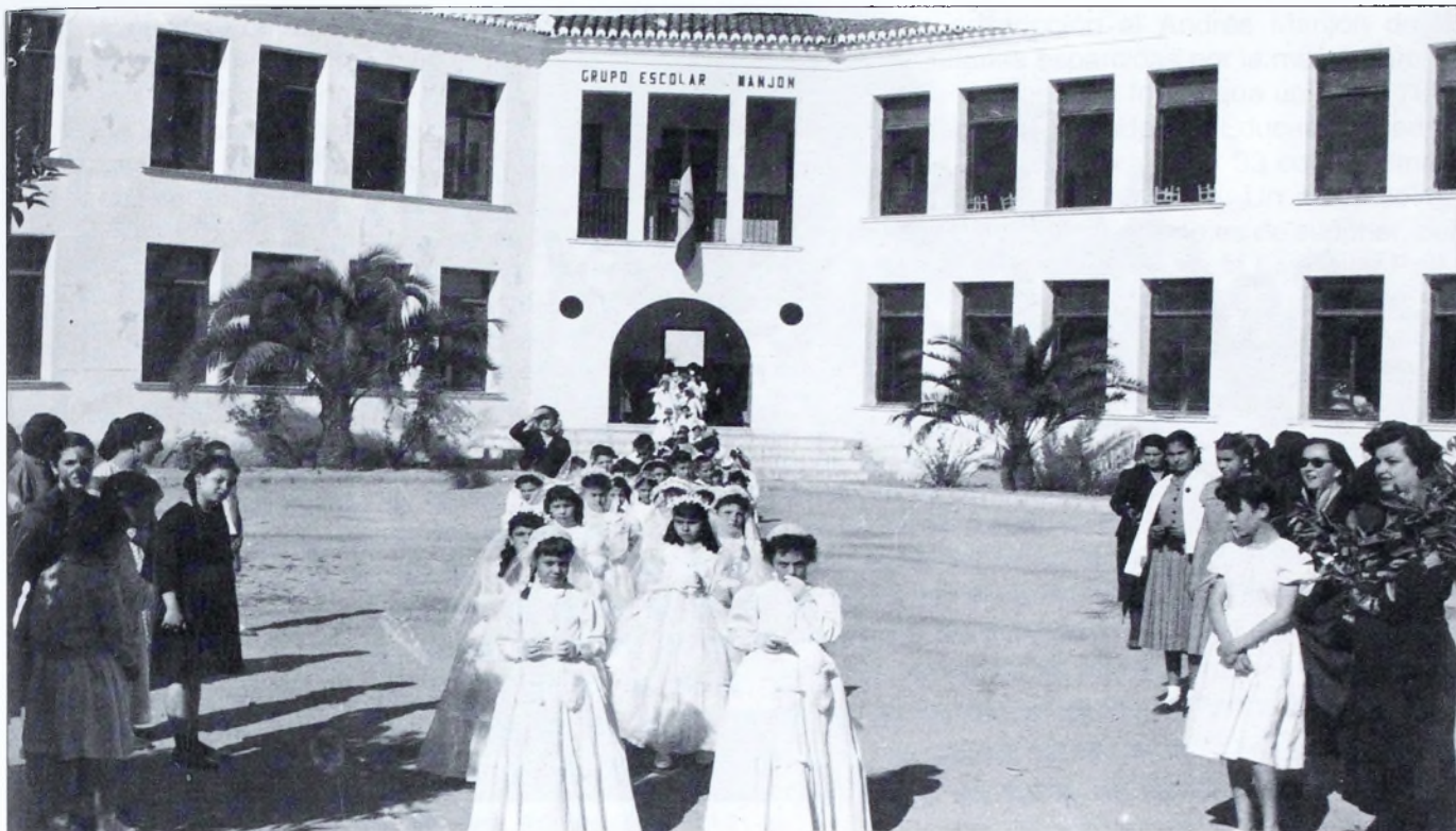
El colegio realizó distintos actos religiosos. En la imagen reunión en el patio para la salida hacia la iglesia en la Primera Comunión de 1956.