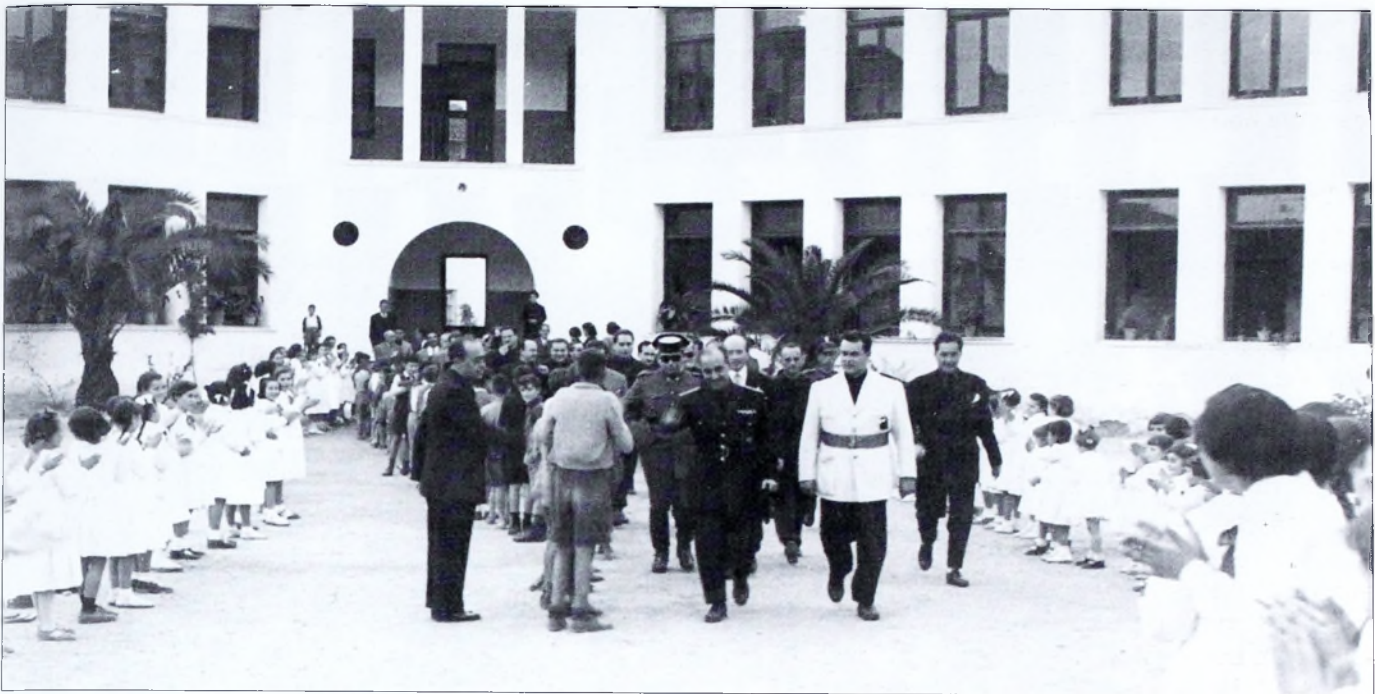
El centro educativo fue reiteradamente visitado por las autoridades. En la imagen visita del año 1950.

te han desaparecido y se han sustituido por radiadores eléctricos.