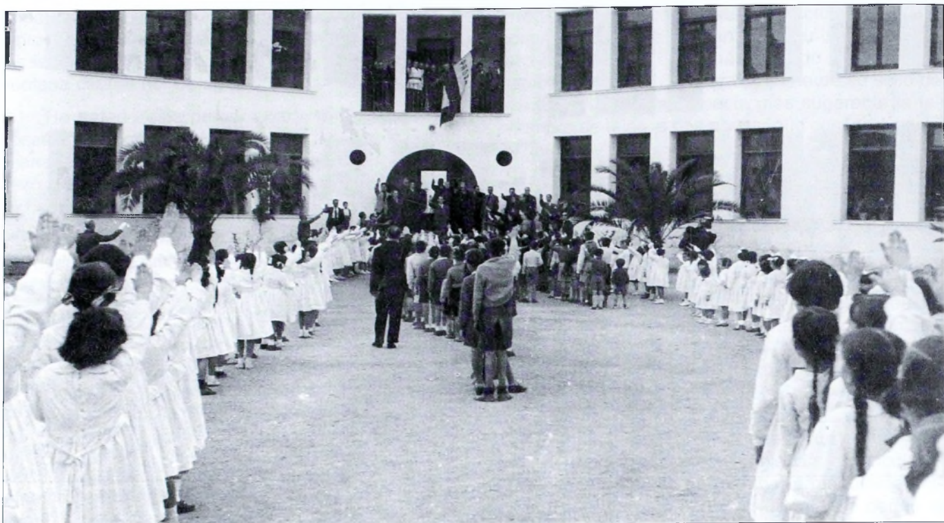
Izando banderas y el preceptivo canto del «Cara al sol» antes de la entrada a clase hacia el año 1950.

Papa Juan Pablo II en su último viaje a España: «Las ideas no se imponen, sino que se proponen». Dios quiera que esta reflexión sea base para el comportamiento humano. Hecha esta pequeña digresión, o reflexión, continuemos.