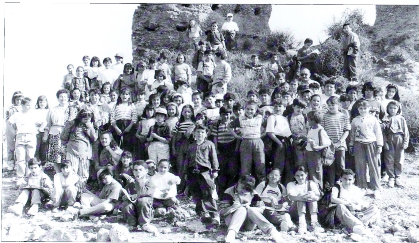
El colegio siempre se preocupó por el conocimiento del municipio. En la imagen una excursión a las ruinas de Villavieja. Abril de 1993.

Creo que he debido dejar muchas cosas en el tintero, frase no muy adecuada a la realidad actual. Seguramente he manifestado algunas no importantes y he olvidado otras fundamentales. Confieso que me ha costado bastante trabajo el seleccionar