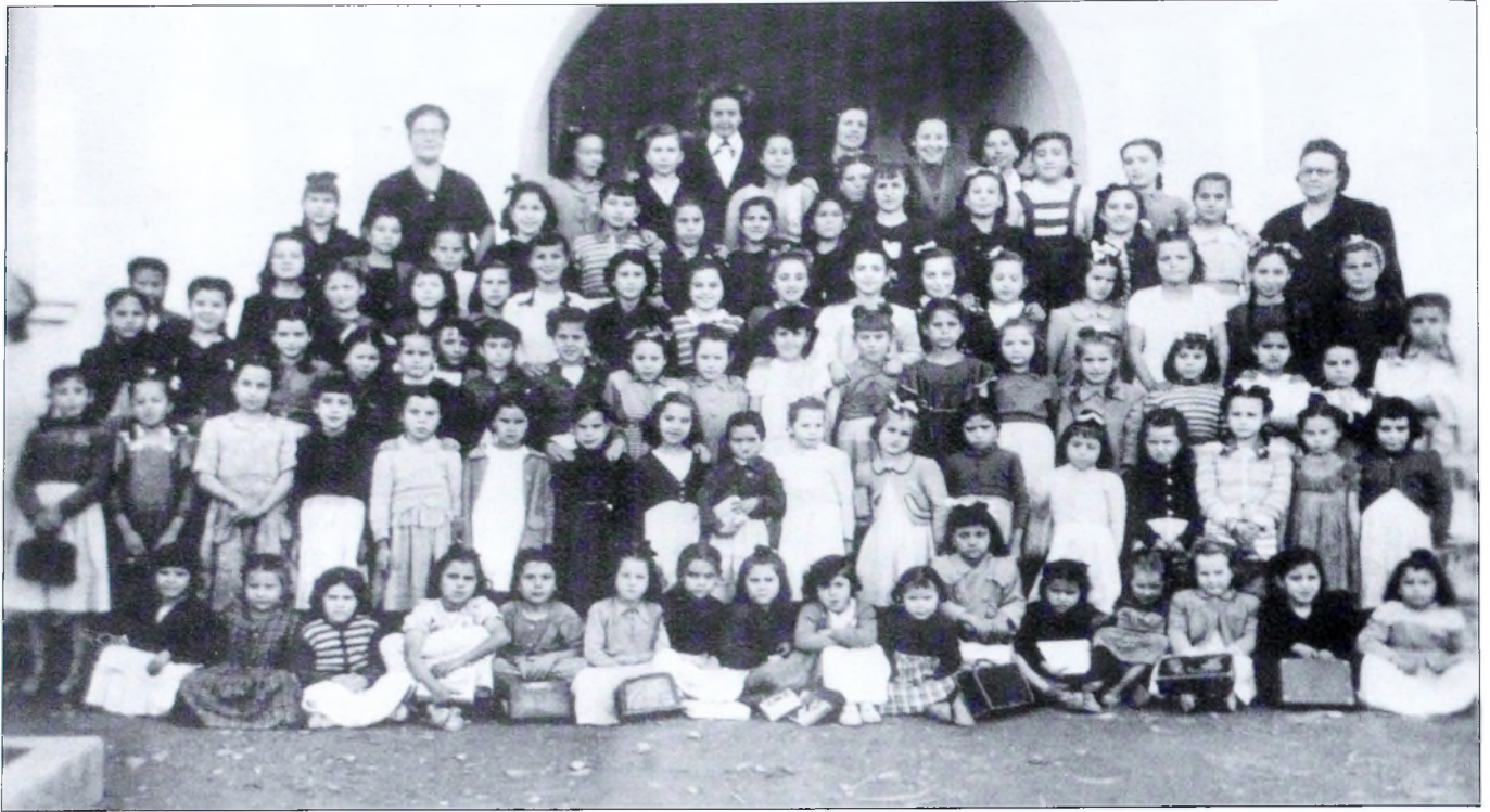
Niñas y maestras del curso 1948-1949.