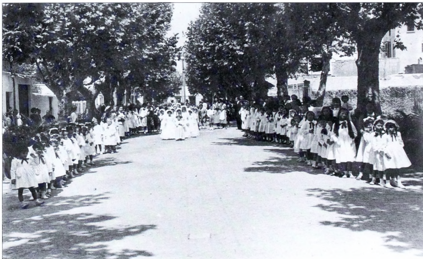
El paseo de Cervantes también fue un ámbito educativo para celebraciones comunitaria. Comunión de 1953.