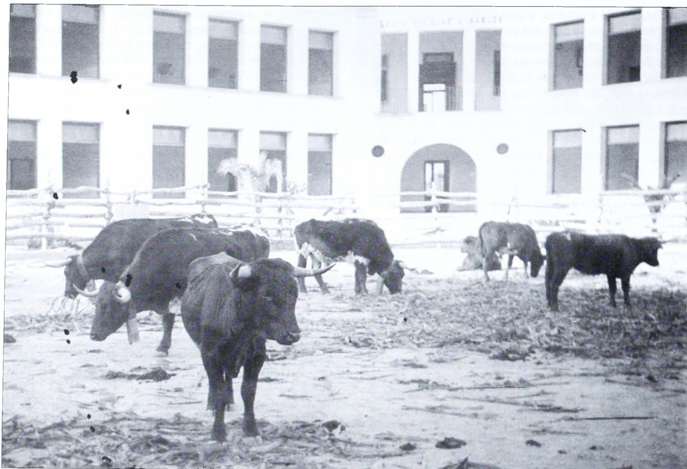
Uno de los múltiples usos del Colegio: Novillada de Feria de 1947. Obsérvese el tamaño de las palmeras.