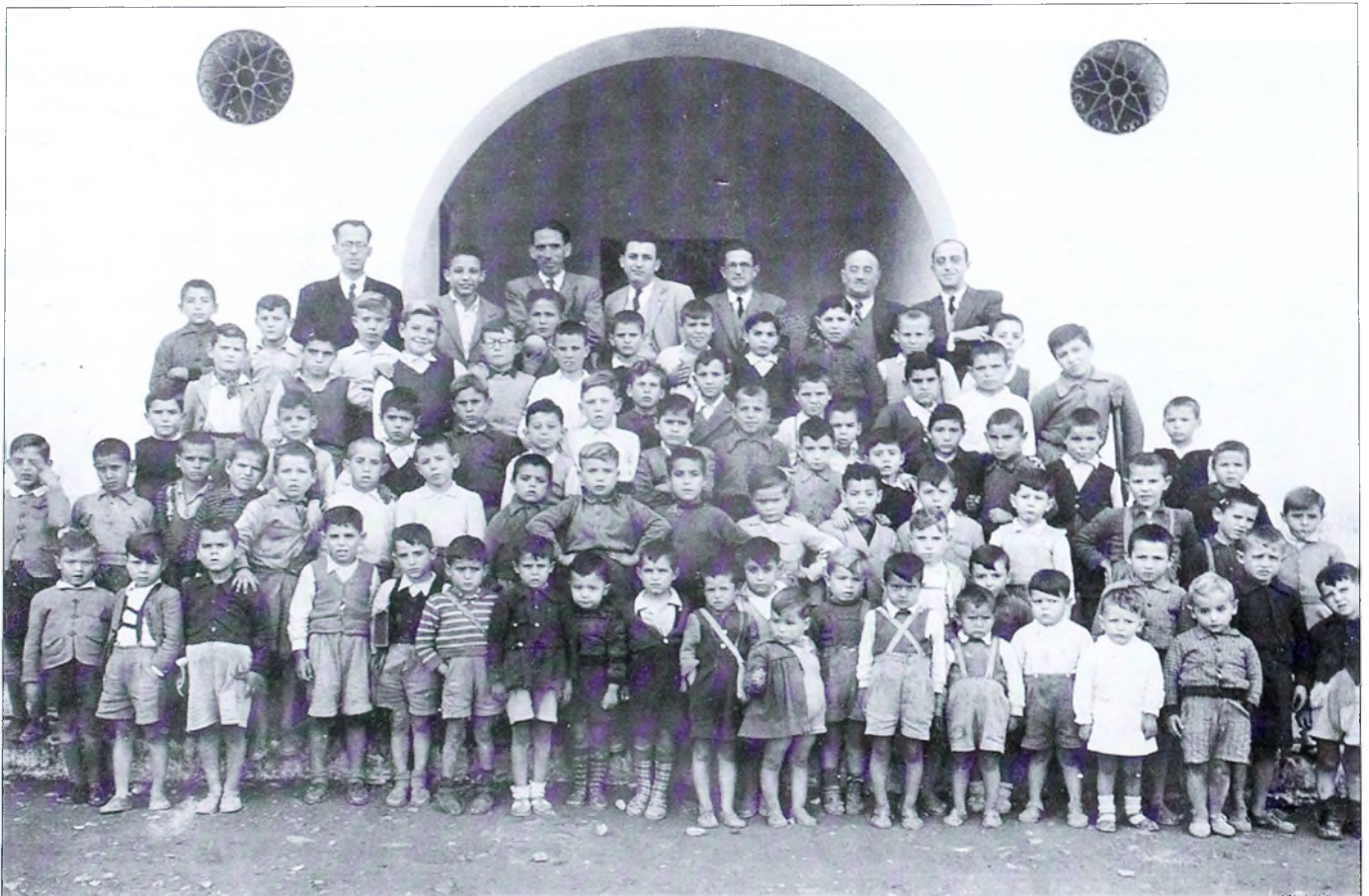
Niños y maestros del curso 1948-1949.