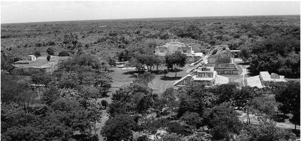
Fig. 3.—Parte sur del epicentro de Ek' Balam, vista desde lo alto de la Acrópolis.