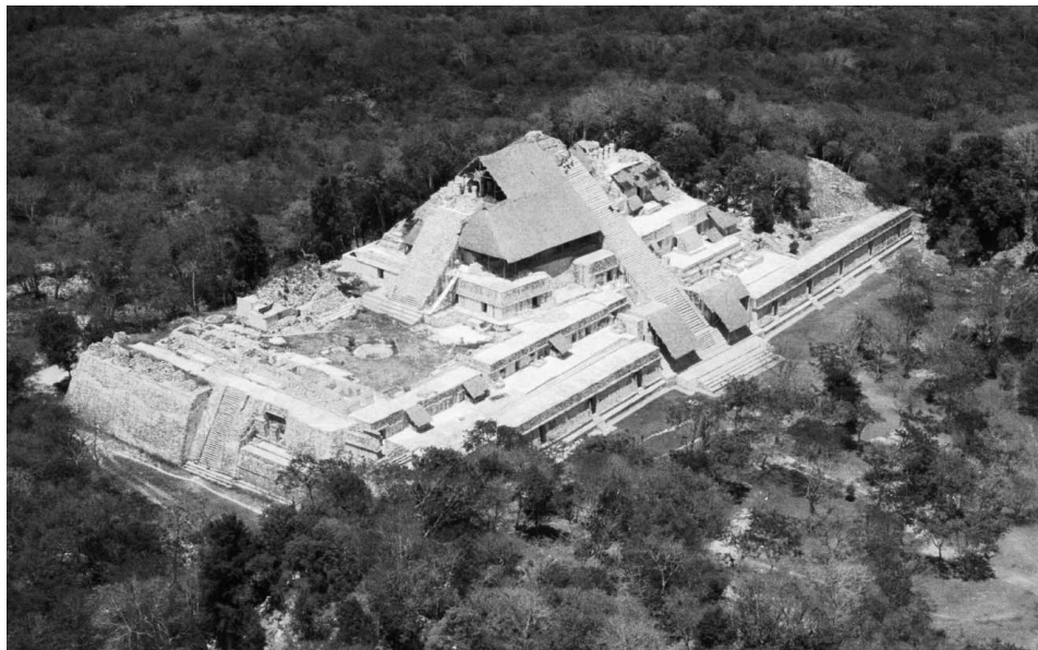
Fig. 1.—Vista aérea de La Acrópolis.

«...Tiquibalon [Ekbalam].... Era en tiempo de su gentilidad una de las principales cabeceras de esta provincia; tiene cinco edificios grandes, todos de cantería de piedra labrada y el uno de ellos, en lo alto de él, hay casas de bóveda y grandes silos adonde echaban el maíz para su mantenimiento, y asimismo sus cisternas donde se recogía el agua que llovía, todo hecho de cantería muy bien obrada. Tienen estos edificios algunas figuras de piedra antiguas, con sus labores y molduras, y parece haber en alguna manera letras, (Fig. 2) que por ser cosa tan antiquísima no se deja entender lo cifrado de ellas. Tiene este edificio más de cuatrocientos pasos en cuadra; súbese a él con gran trabajo por haberse derrumbado los escalones que tenía por donde se subía a él y por ser muy altísimo, y del alto de él se divisa todo aquello que puede ver uno de buena vista (Fig. 3). Tiene en lo alto de él una gran llanura donde hacían sus fiestas y en él hay tres pilares grandes donde está asentada una piedra redonda grande ...; tiene otras muchas figuras de piedra que parecen hombres armados y los demás edificios de la misma cantería a lo antiguo...» (Gutiérrez 1983: 138).