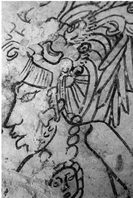
Fig. 8.—Detalle de la Tapa de Bóveda 15, donde se ve el rostro del rey, personificado como el dios del maíz, pero mostrando un defecto en el labio superior para identificarlo.