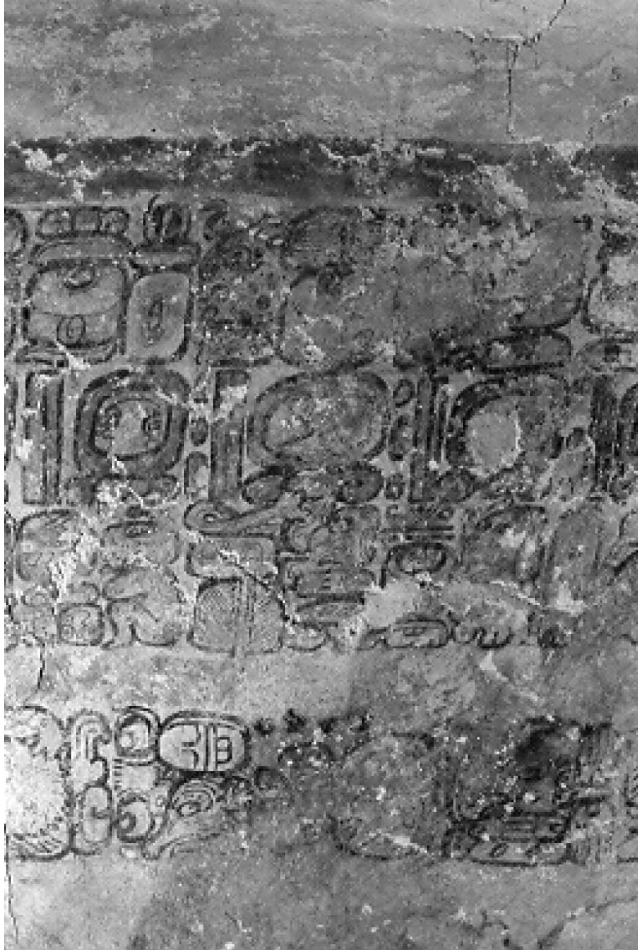
Fig. 5.—Fragmento del Mural de los 96 Glifos.

Ukit Kan Le'k Tok' en 770 d.C., evento que fue registrado con la expresión i patlaj Talol Ajaw «entonces se hizo el rey de Talol», que cierra el texto del Mural de los 96 Glifos (Lacadena 2003).