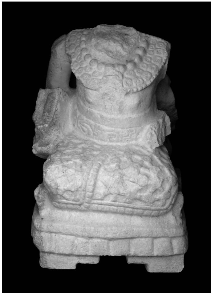
Fig. 4.—Escultura femenina, la única encontrada hasta ahora en La Acrópolis, que podría representar a la reina.

Castillo 1998). Hasta la fecha no ha sido localizada ninguna otra construcción de temporalidad diferente al Clásico Tardío.