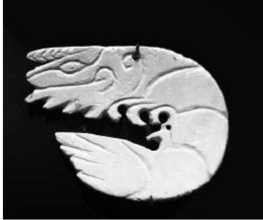
Fig. 6.—Pendiente de concha en forma de camarón perteneciente a la ofrenda funeraria de Ukit Kan Le'k Tok'.

gunos monumentos muy importantes. Su alta jerarquía hizo que le fuera destinado como tumba uno de los lugares más especiales de su palacio real, curiosamente, en una de las partes más altas del edificio 4 y con una muestra de sus grandes riquezas materiales, que se depositaron como una suntuosa ofrenda, en la que destacan elementos tales como vasijas de alabastro, numerosas y singulares piezas de concha (Figs. 6 y 7) —que predominan por encima de las de jade— así