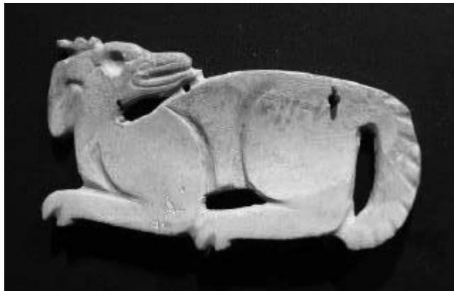
Fig. 7.—Pendiente de concha en forma de venado perteneciente a la ofrenda funeraria de Ukit Kan Le'k Tok'.