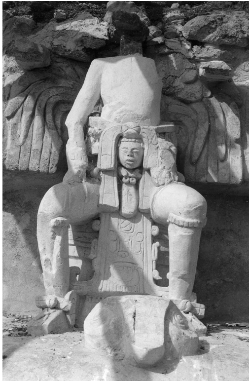
Fig. 9.—Escultura que posiblemente representaba al ajaw Ukit Kan Le'k , ubicada en el friso de la fachada estilo Chenes de La Acrópolis (fotografía de V. Castillo).

Otros retratos del ajaw fueron creados por sus descendientes, como es el caso de la Columna 1, dedicada en 830 d.C. por Ukit Jol Ahkul , donde lo vemos como un imponente guerrero, con una lanza y un escudo hecho de placas de concha, objeto que creemos haber hallado en su tumba, aunque completamente deshecho. La última de sus representaciones conocida es la de la Estela 1 donde, en 840 d.C., K'uh...nal (o K'ihnich Junpik Tok' K'uh...nal ) lo mandó esculpir en la parte superior del monumento, como ancestro divinizado.