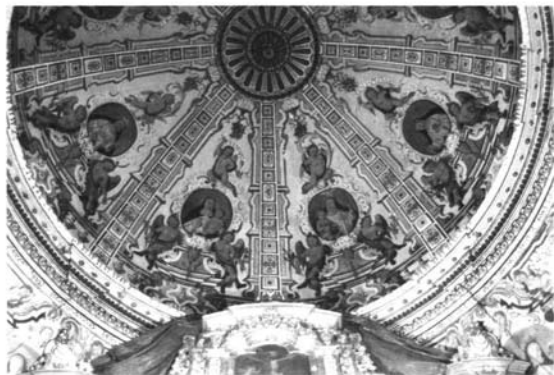
3. Detalle de las Santas