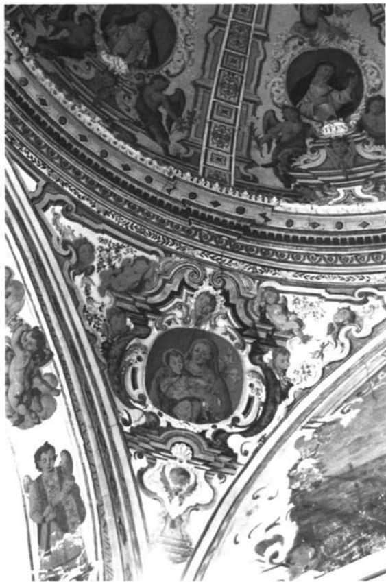
1. Detalle de la Pechina