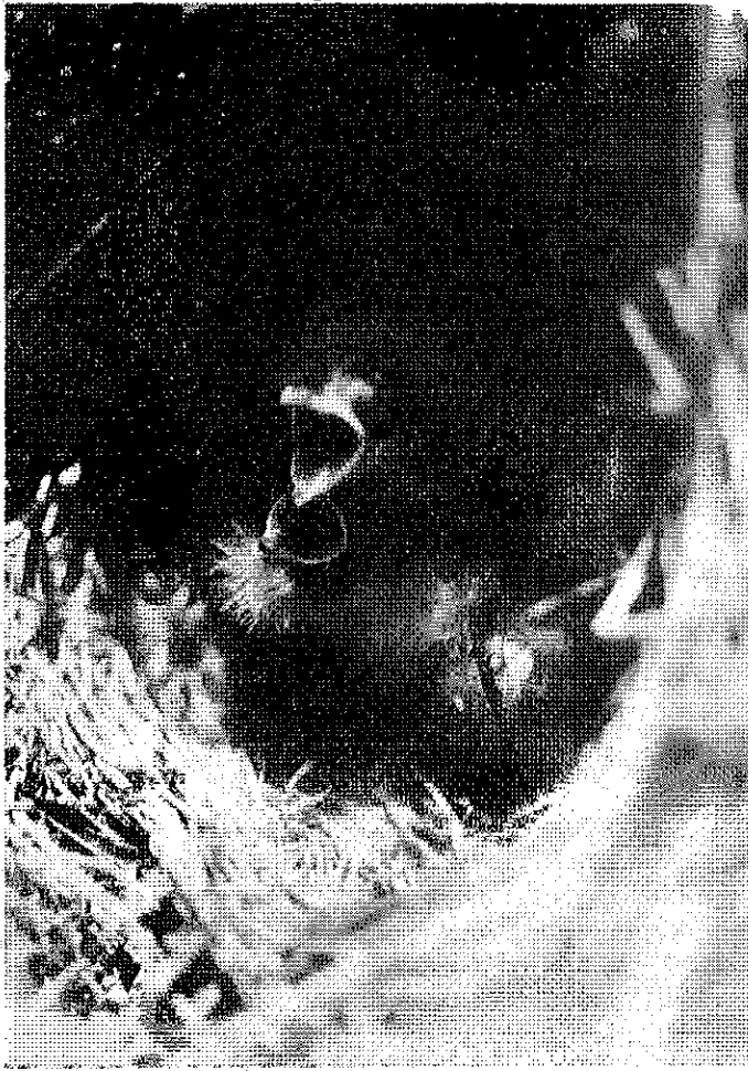
Fig. 5.- Pollos recién nacidos

bajosamente deglutía la cintura pélvica. Conservamos la presa congelada. Ni rastro de los restantes pollos.