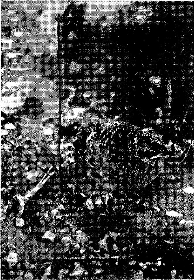
Fig. 6.- Pollo volantón