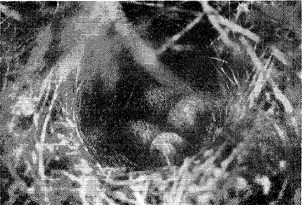
Fig. 2.- Puesta

Basándonos en observaciones de un miembro del equipo en la primavera de 1984 (Manrique, inédito) delimitamos una parcela de 1.000 × 500 ms. en el área de referencia en la que se establecieron cuatro estaciones de escucha. Efectuadas cinco escuchas de media hora, a las 8 horas, los días 17, 20, 23, 25 y 27 de Marzo (1986), sólo se obtuvieron tres contactos acústicos en diferentes puntos de la parcela. Ante la pobreza de resultados y la certeza de su relativa abundancia se decidió modificar el método de prospección. Se diseñaron cuatro itinerarios de 5 kms. aproximadamente que fueron cubiertos individualmente desde las 8 h. del 29 de