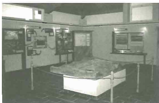
Las Médulas. Aula arqueológica.

Desde el aula se sugieren igualmente rutas de visita que orientan hacia un mejor conocimiento del paraje arqueológico, que se corresponden con una señalización adecuada de éste en sus distintos puntos de interés, a cuyos efectos se encargó hace unos años un modelo de diseño gráfico aplicable en todos los yacimientos puestos en valor.