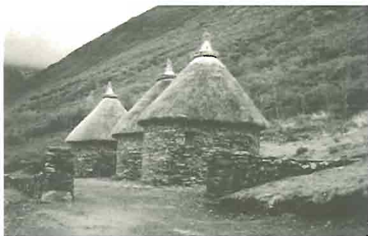
Castro de Chano. Recreación de cabañas.

Aunque no vinculado a la Administración Autonómica se plantea, siguiendo esquemas similares, la creación de un aula arqueológica en el yacimiento romano de Lancia (Villasabariego) por su propietaria, la Diputación Provincial de León.