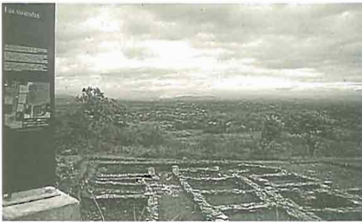
Las Médulas. "El Casetín". Señalización.

Ambas disposiciones abren una clara posibilidad de crecimiento y de mejora de los actuales museos de sitio que sólo depende de la línea política que se quiera aplicar en cada momento.