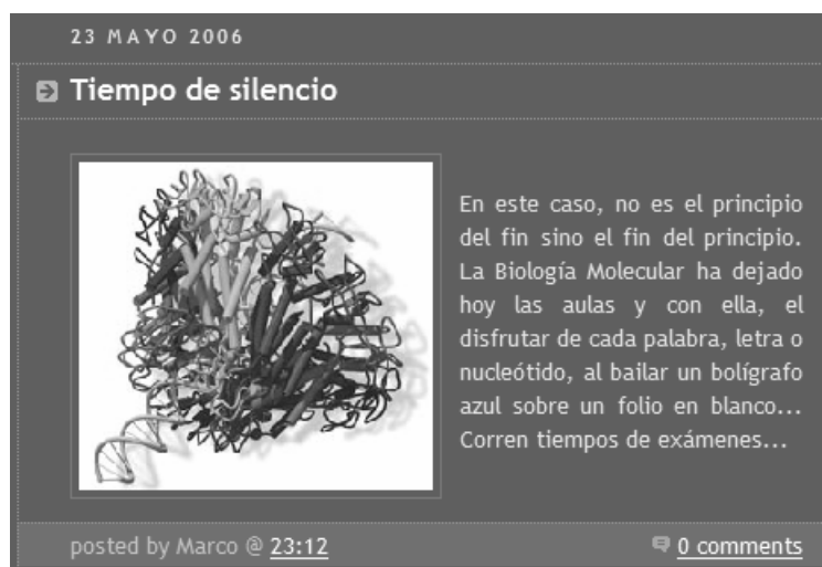
Figura 5. Entrada en la bitácora "El Rincón de Marco", http://divulgacion-cientifica.blogspot.com/