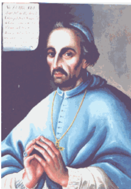
Óleo en tela de José de la Merced Rada, 1844 9

Estudió con un preceptor de Gramática y pasó a los estudios mayores en la Universidad de Alcalá donde fue colegial de San Jerónimo de Lugo 7 y posteriormente, el 17 de octubre de 1705 era admitido en el Colegio Mayor de San Bartolomé de Salamanca donde acabó el doctorado en Teología 8 .