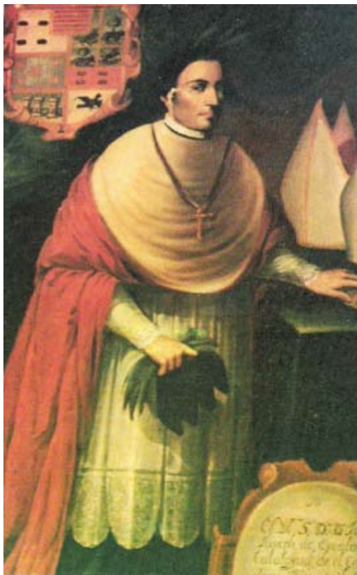
Cuadro de Juan José de Escalona y Calatayud 29 .

Se acusó al gobernador de desacato ante la Audiencia de Santo Domingo y los alcaldes ordinarios quedaron a la cabeza del gobierno. El obispo Escalona y Calatayud reclamó al gobernador, pero los alcaldes se negaron a entregarlo. La Audiencia de Santo Domingo amenazó al obispo Escalona con multarlo si liberaba al gobernador. El 25 de mayo de 1724 el gobernador Portales se escapó de su prisión y se refugió en el templo de San Mauricio. Con la autoridad de la Cédula Real el obispo favoreció al gobernador.