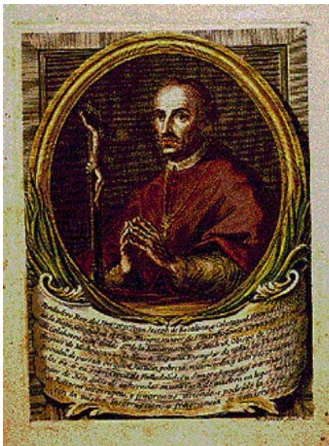
Grabado al buril y coloreado a mano de M. Sorello (1740) 77 .

La autoridad del obispo muerto y sus incorruptas entrañas son los autores de su propia historia y las pruebas de la vida ejemplar. Su milagrosa incorruptibilidad necesita ser autorizada, por eso, el poder político y eclesiástico se unieron para confirmar el supuesto milagro.