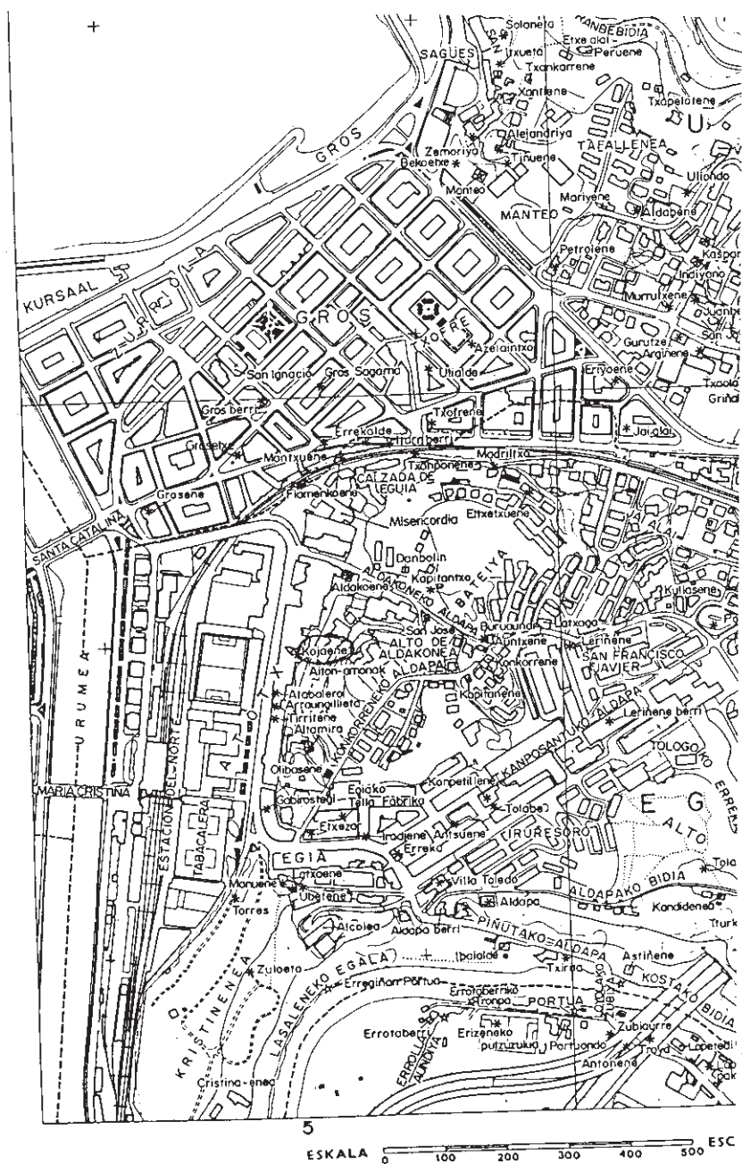
PLANO 1 Sobre un plano reciente, J. Tellabide ha señalado el nombre de los caseríos que existían en sus emplazamientos aproximados