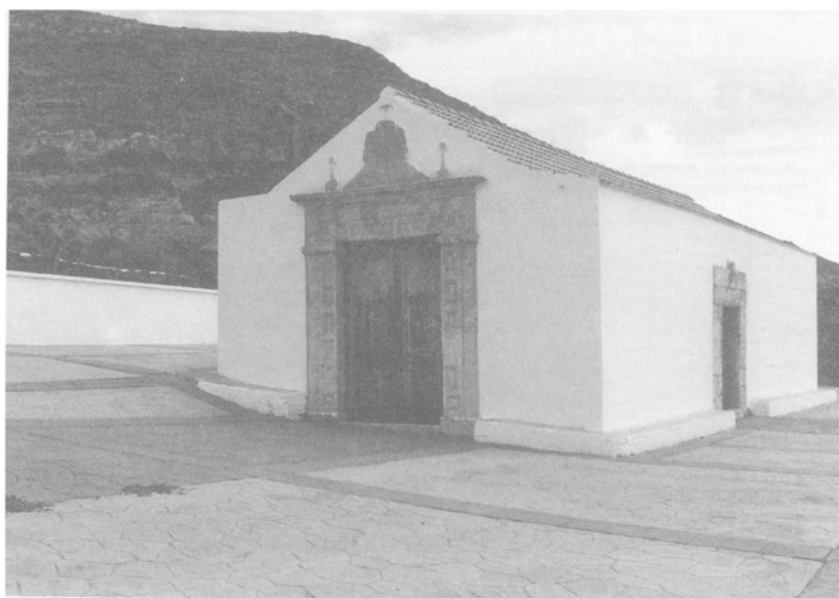
Ermita de Vallebrón.