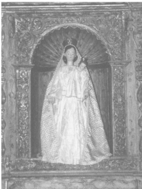
Imagen de Ntra. Sra. de Gracia.