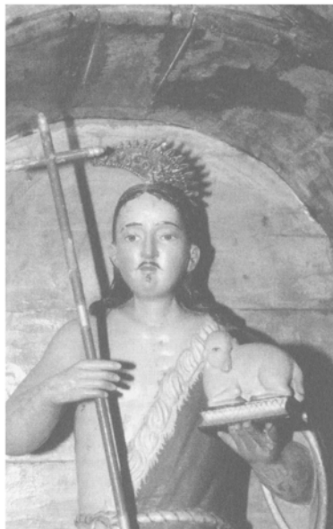
Imagen de San Juan Bautista.