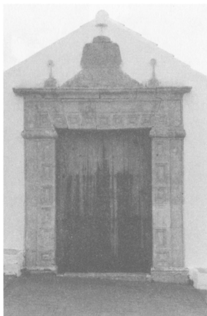
Portada de la fachada principal.