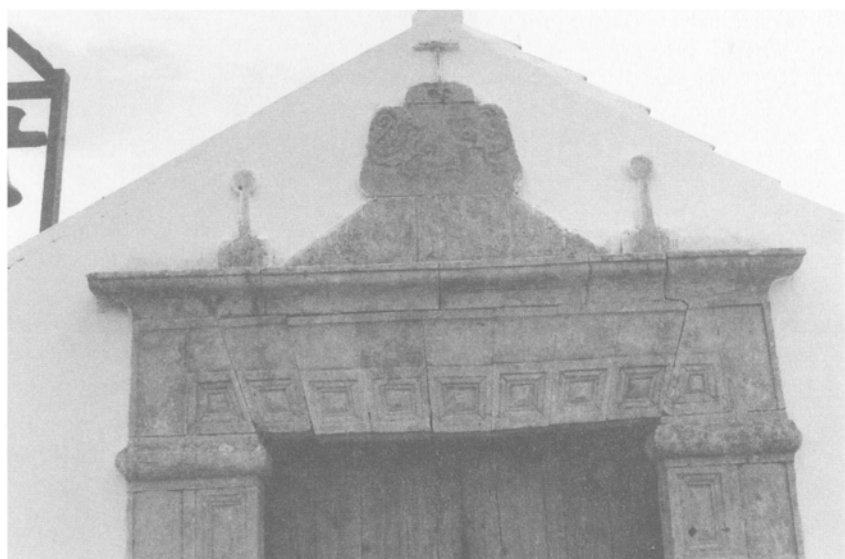
Detalle de la fachada principal.