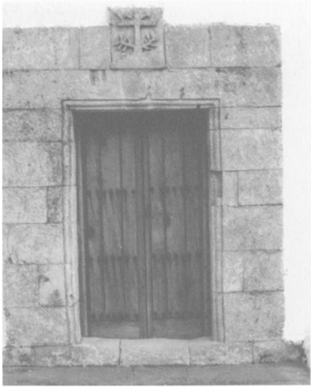
Portada de la fachada sur.