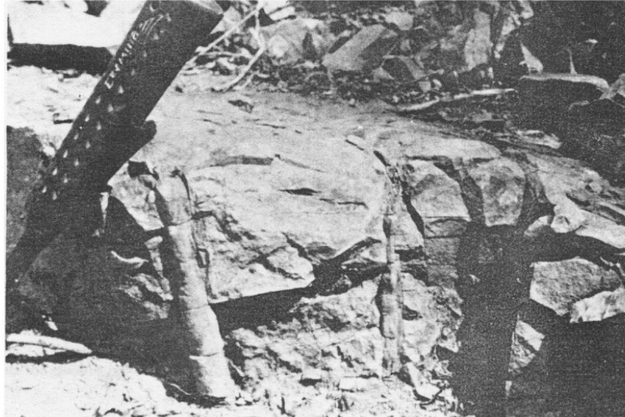
Figura 2.- Impresiones de tallos de Calamites ssp., in situ .

Macroscópicamente, la secuencia consiste en una alternancia de areniscas cuarzo-feldespáticas, con fragmentos líticos gruesos, micáceas, algunas ocasiones en bancos comúnmente de 12 a 25 cm de espesor y delgados horizontes de pizarras carbonosas. Las areniscas son en ocasiones conglomeráticas e intercalados aquí y allá lentes y horizontes conglomeráticos; hacia arriba la secuencia es aparentemente transicional a bancos conglomeráticos, que raramente presentan plantas fósiles. Las calizas mesozoicas cubren discordantemente a estos conglomerados.