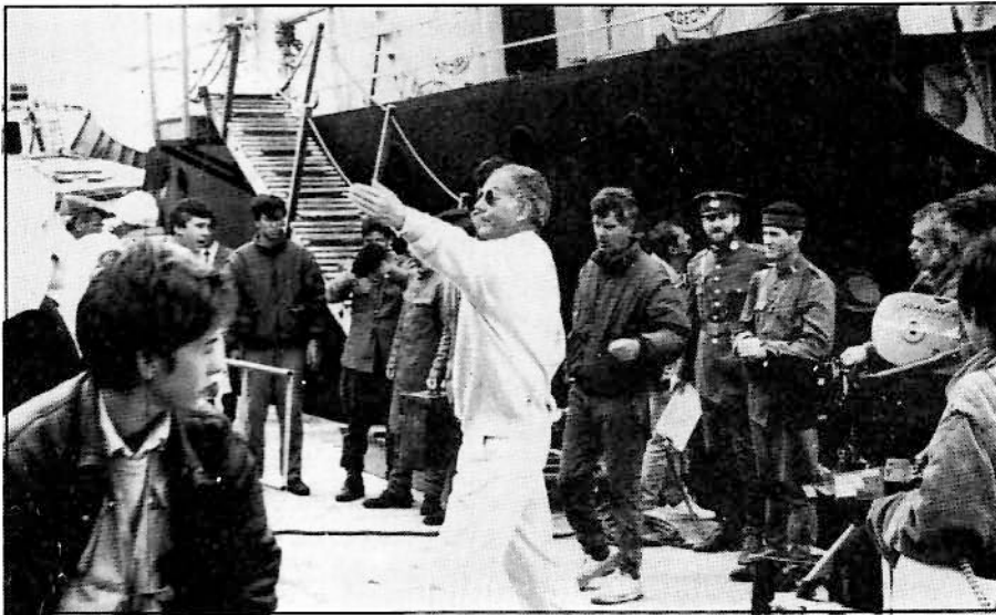
Un momento del rodaje de La forja de un rebelde

gentes del pueblo las que actuaron como extras.