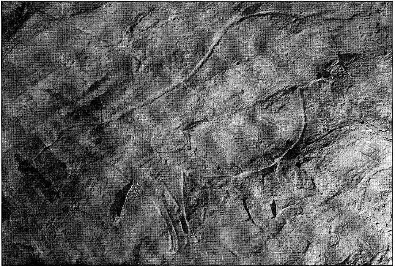
Fotografía del grabado de una yegua preñada.