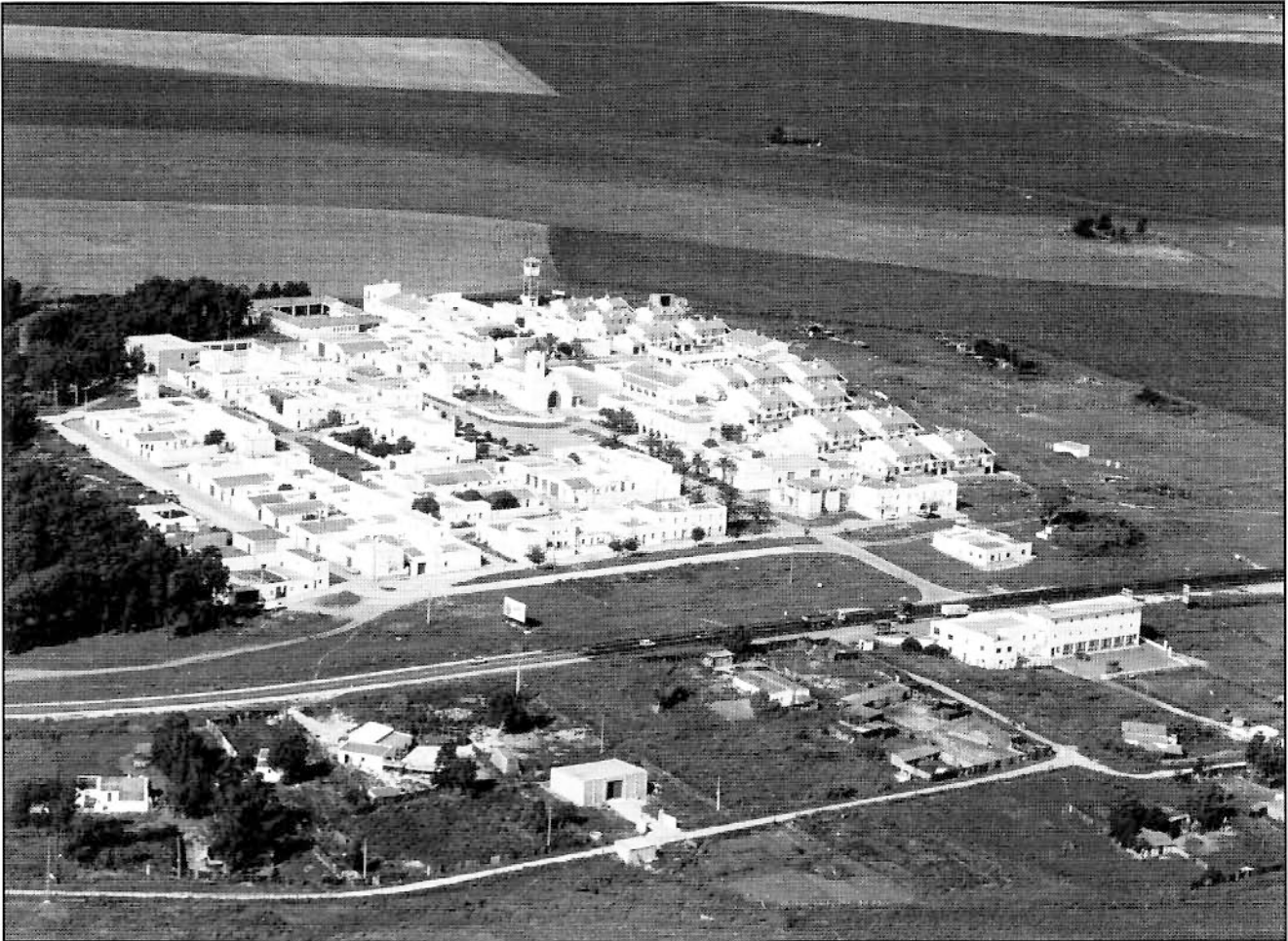
Imagen actual del poblado de Tahivilla.

número de viviendas para profesionales eran cuatro, construyéndose al final cinco. Consecuencia de ello fue el desglose del proyecto del poblado de la escuela junto a una casa para maestro en un lateral de ésta, resultando una casa de más en el total. Las ocupaciones de estas viviendas fueron según se detallan a continuación.