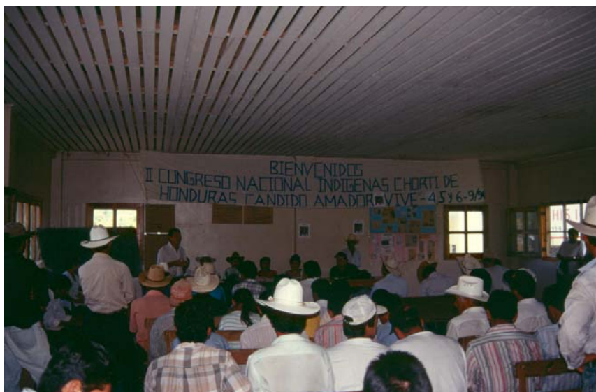
IMAGEN 1. II Congreso Nacional Indígena Chortí de 1998. Rincón del Buey.

Los elementos centrales del movimiento socio-religioso proceden de los mensajes proféticos de su líder, basados en componentes culturales ancestrales mayas y en las costumbres tradicionales del proceso de aculturación tras la conquista. La aparición concreta en los años noventa se puede también explicar por la convergencia de los factores anteriores, el descontento por las condiciones de vida, la autoconciencia de la necesidad de lucha y transformación social que generaron los movimientos indios en toda Latinoamérica y la cristalización concreta de elementos psicológicos, sociales y culturales en un líder mesiánico como Guillermo García.