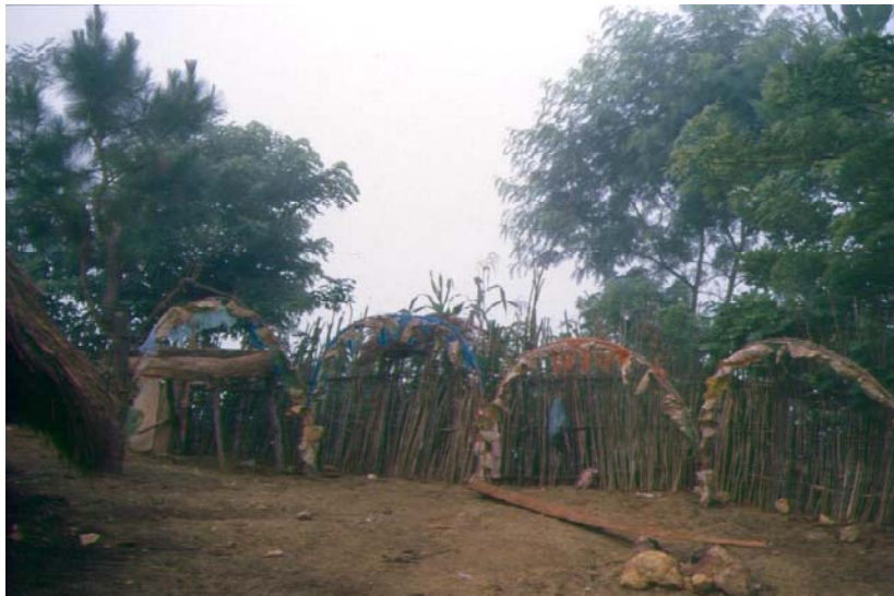
IMAGEN 2. Patio del centro ceremonial de la Iglesia Nuevo Siglo. San Antonio Tapescó.