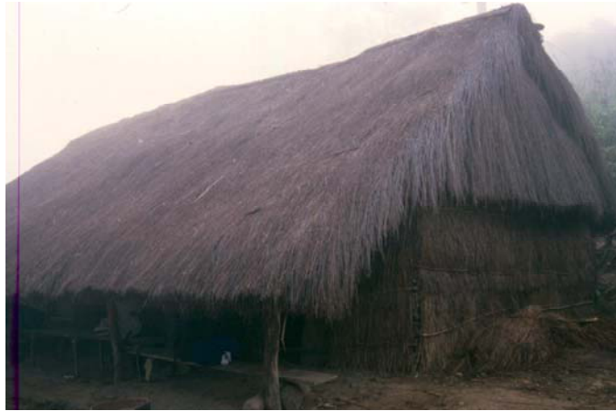
IMAGEN 3. Centro ceremonial de la Misión Santa del Nuevo Siglo. San Antonio Tapesco. (Foto de los autores).