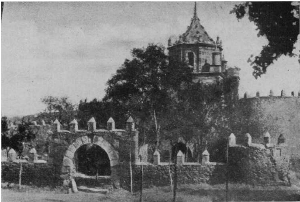
Monasterio de Veruela : Puerta del recinto exterior y vista del torreón.