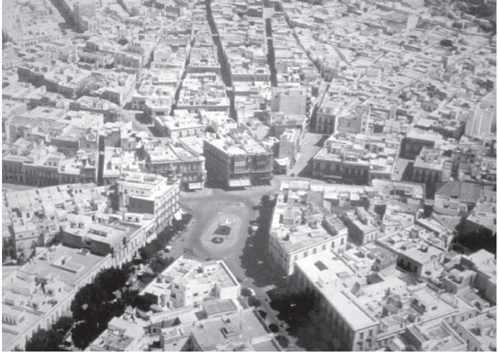
1. Vista de la Almería “horizontal” a finales de la década de los 50.