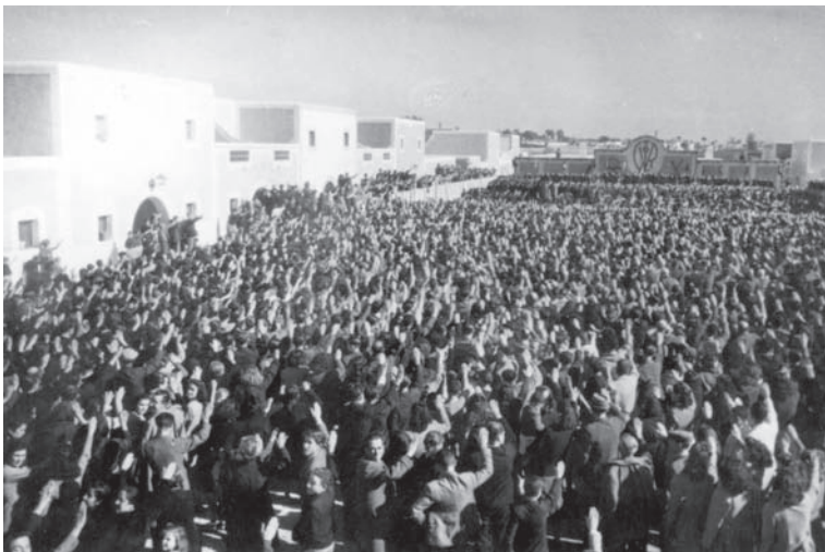
5. Barriada de Regiones. Multitudinaria concentración con motivo de la visita del ministro de la Gobernación para su inauguración el 30 de Noviembre de 1944.

La construcción más representativa y respuesta al problema de las cuevas será la barriada de Regiones Devastadas en la carretera de Ronda en el cruce con la carretera de Níjar, levantada en el plazo record de 9 meses. Allí se levantan en 1943 un conjunto de 317 viviendas en 18 manzanas (el primitivo proyecto era de 800 viviendas), con una inversión de 2,5 millones de la época (sólo la construcción de la actual Subdelegación del Gobierno supuso 7 millones).