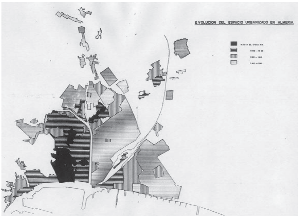
13. Evolución del espacio urbanizado en Almería.

Las zonas donde las actuaciones urbanísticas son más intensas son el norte del casco antiguo y el ensanche de Levante. Al oeste de la rambla hay un fuerte dinamismo constructivo en la huerta de Santa Rita con la calle Dolores R. Sopena, y en la zona de la Plaza de Toros en los barrios de la huerta de Jaruga y la Caridad. La expansión a Levante, al otro lado de la rambla, se organiza en unos ejes este – oeste formados por las actuales calles de San Juan Bosco (como prolongación de Alcalde Muñoz), Paco Aquino (prolongación de Santos Zárate) y Gregorio Marañón (prolongación de Obispo Orberá), mientras que perpendicularmente se diseñarán las calles Altamira y Hermanos Pinzón ya en la década de los sesenta. Con estas actuaciones la ciudad ha ocupado el espacio entre la rambla y la carretera de Ronda, que se convertirá en la nueva frontera urbana hasta prácticamente la década de los sesenta.