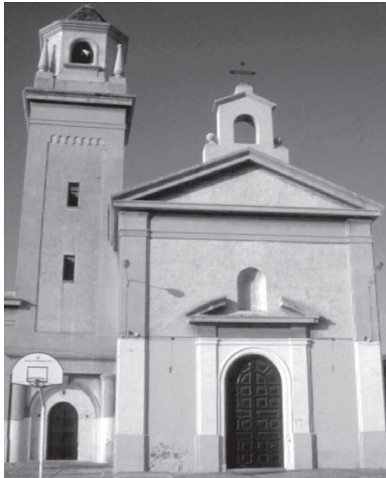
7. Barriada de La Chanca. Fachada de San Roque en la actualidad.

Una utopía semejante será la barriada de San Roque (1946) en Pescadería, diseñada como una regeneración de pescadores, aunque el proyecto quedará muy incompleto en cuanto al modelo de urbanismo orgánico por construirse sólo parte de los bloques de viviendas y la iglesia. La escalera imperial salvando el desnivel entre la plaza de la iglesia y la carretera nacional será el elemento más representativo y monumental. Aquí no se recurre a una utopía rural sino a los modelos representativos de la arquitectura herreriana y clasicista, también cercanos ideológicamente al régimen por enlazar con la grandeza imperial de España durante el reinado de Felipe II.