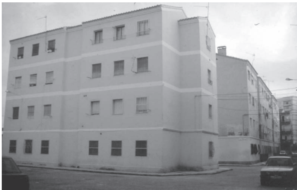
16. Grupo sindical "Alejandro Salazar". Frialdad y falta de equipamiento con el espacio interbloques.

En 1954 se diseñan las promociones Obispo Diego Ventaja y Jacinto Matarín en el Zapillo, mientras que el grupo 18 de Julio (más arriba de la C/ Granada y junto a la rambla) nos ofrece una vivienda de 46 m 2 útiles de 3 dormitorios para una familia media española de 6 miembros, con un comedor de 11 m, dormitorio de matrimonio de 7,2, de los hijos de 5,28 con dos camas de 0,70, y cocina de 4. Es todo un record, pero constituía toda una reivindicación para muchos almerienses sin vivienda digna.