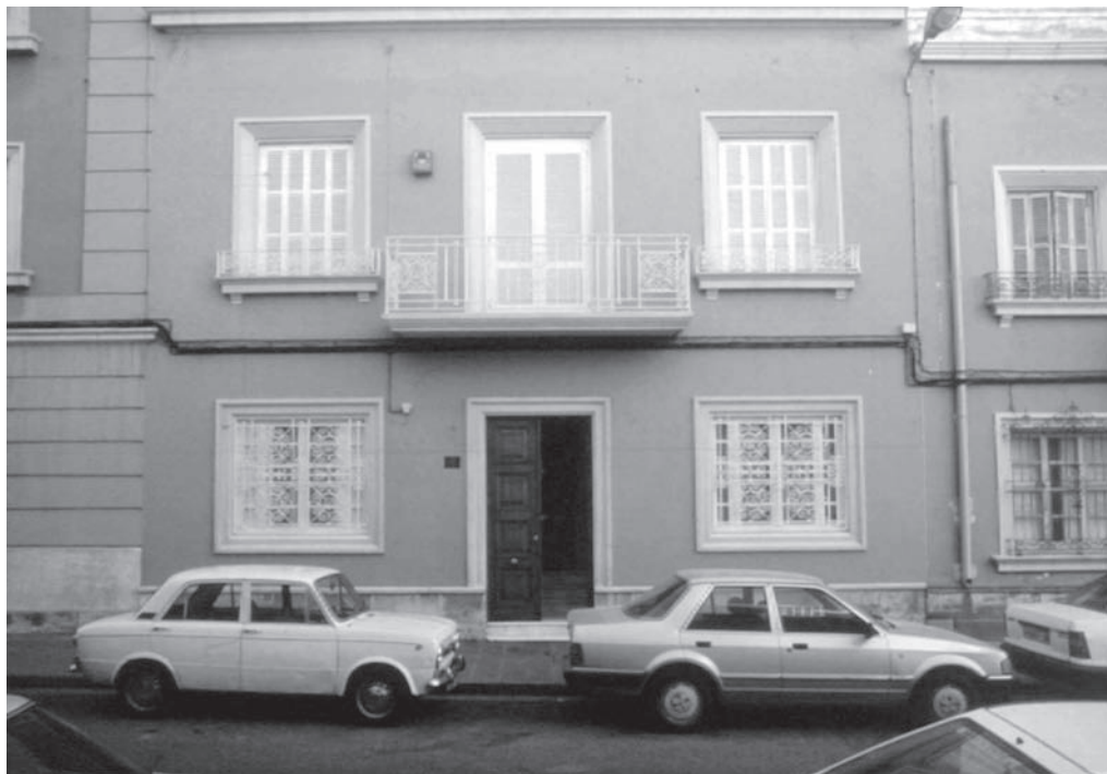
14. Vivienda en C/ Dolores R. Sopena, del Grupo de Viviendas "Virgen del Mar".

rior. Cuesta trabajo pensar que una dotación espacial de poco más de 8 m 2 por persona sea el prototipo de vivienda de los años cincuenta y normal para cubrir las necesidades mínimas del individuo.