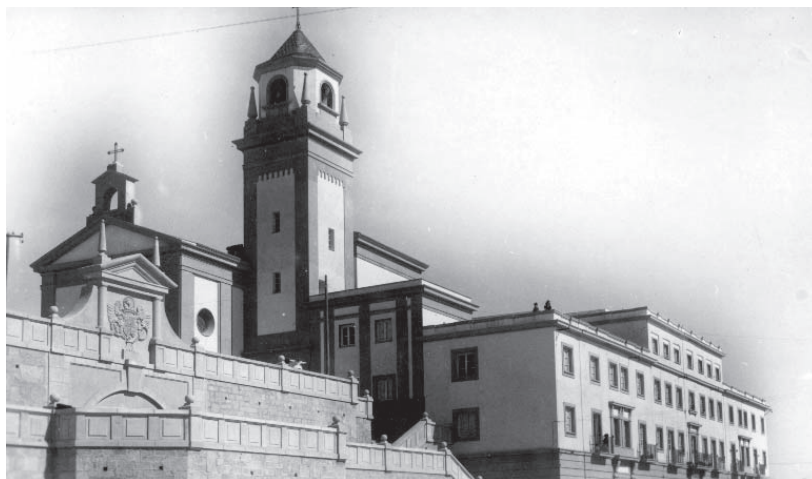
6. Barriada de La Chanca.

Las viviendas responden a una tipología rural, donde el patio abierto ocupa la mitad de la superficie y adquiere un carácter globalizador de cocina, comedor y cuarto de estar, mientras que el diseño externo responde a modelos populares de volúmenes puros y paredes encladas, con connotaciones de arquitectura norteafricana y mediterránea en los pasadizos cubiertos, los ajimeces, la cubierta plana... El resultado será excelente desde el punto de vista teórico y compositivo, pero totalmente descontextualizado en cuanto a la desnaturalización de un modelo de vivienda rural adaptada a la ciudad. Las inmediatas modificaciones de sus habitantes desde la inauguración, haciendo hoy la barriada prácticamente irreconocible con respecto a su diseño original, son las consecuencias claras de esas descontextualizaciones. Pero además se planificó en el antiguo extrarradio urbano, con arreglo a un modelo de discriminación y zonificación social.