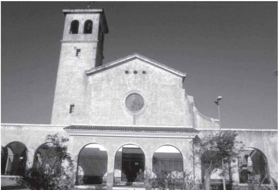
10. Iglesia de San Antonio de Padua en la actualidad.

Sin embargo a nivel arquitectónico se usan elementos tradicionales y populares almerienses, pero también el racionalismo de los ritmos horizontales y la ventana continua, modelo que alcanzará su máxima expresión en el colegio Lope de Vega. Se ha combinado el urbanismo falangista, la arquitectura popular (iglesia y mercado), el vanguardismo arquitectónico (colegio y viviendas, con el ladrillo visto, los óculos, la ventana continua, los ritmos horizontales ...), y la utopía howardiana, en una mezcla que reflejara el carácter acomodaticio de la cultura franquista.