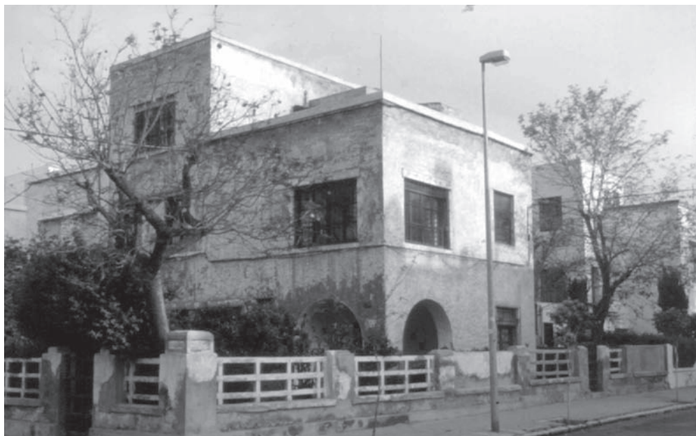
11. Barriada de Ciudad Jardín. Vivienda tipo A en C/ El Salvador, esquina América.