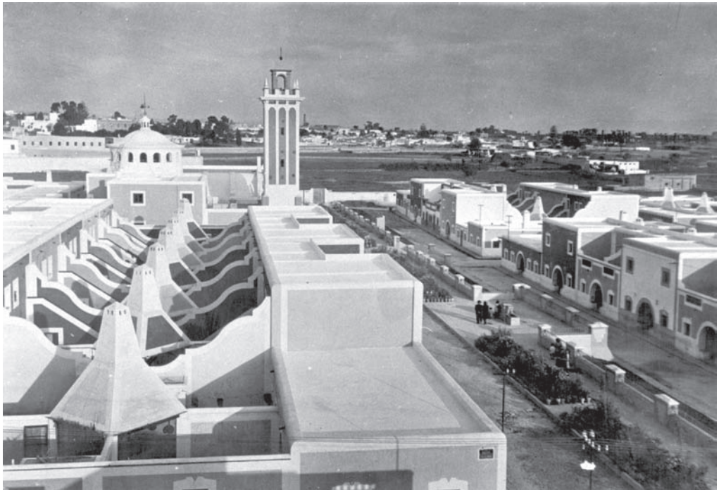
2. Barriada de Regiones. Vista de la plaza formada por la C/ Alta y Baja de la iglesia.

Desde el 1 de abril de 1939 comienza en España un “nuevo orden” político de carácter autoritario que marcará todo un estilo de vida hasta 1975. El nacionalismo, el conservadurismo, la utopía imperial, la demagogia, el partido único... serán unas referencias ideológicas de este período y tendrán una proyección en los modelos urbanísticos y arquitectónicos del momento, especialmente hasta 1959, fecha del Plan de Estabilización, que supuso el retorno de España a los circuitos del capitalismo mundial.