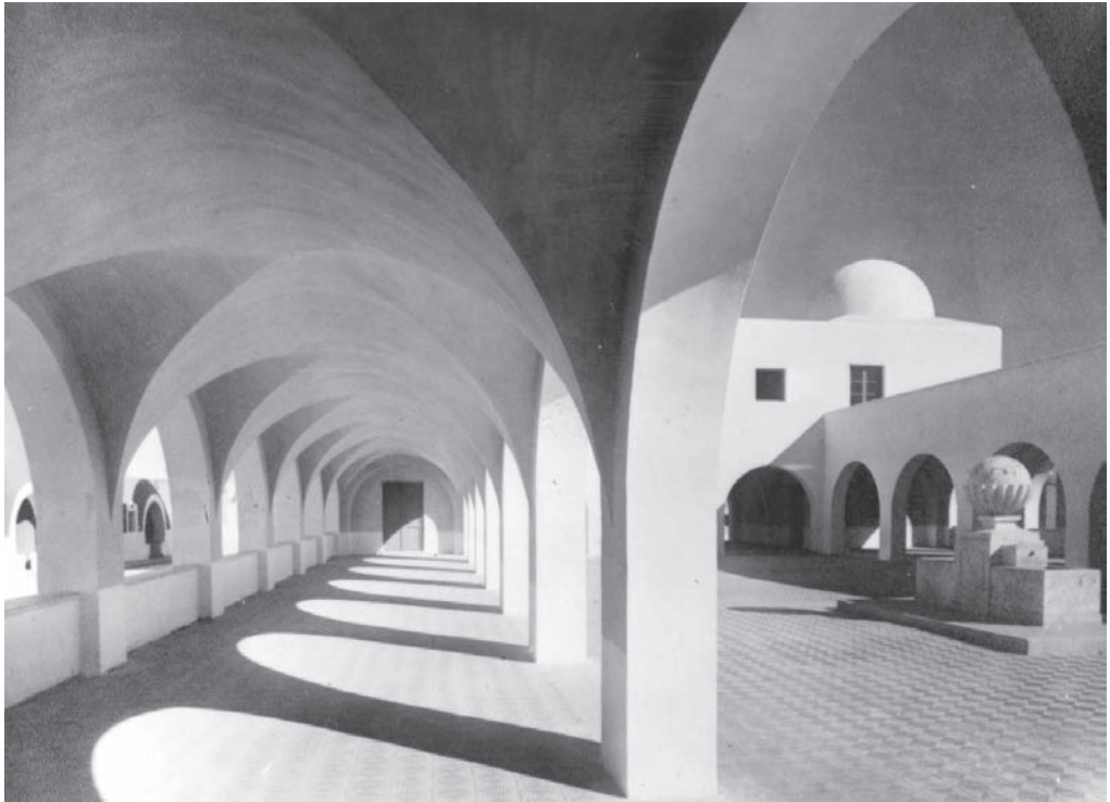
3. Barriada de Regiones. Arquería de mercado.

La gravedad del problema de las destrucciones, el atraso económico secular y el grave déficit de viviendas existentes (en 1940 estaban censadas 2.520 cuevas albergando a 18.200 personas en un cinturón de pobreza rodeando el casco urbano, con un fuerte peligro de enfermedades infecto – contagiosas), eran una magnífica oportunidad para un régimen que manipularía las urgentes necesidades de ayuda estatal. Las imágenes de las cuevas de la Chanca, Cerro del Hambre, la Fuenteica o Cementerio debían ser borradas urgentemente, según las declaraciones oficiales de las jerarquías franquistas. La vivienda aparecía como un problema real, una materia prima utilizable como instrumento de discusión teórica y de manipulación ideológica, tal como reflejan los titulares de la prensa de la época: