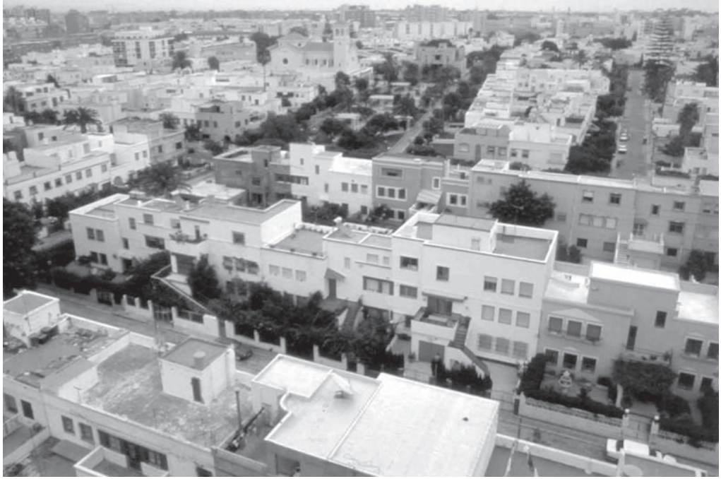
12. Barriada de Ciudad Jardín. Vista general en la actualidad.

El Plan de Prieto Moreno de 1950, el primero conocido por nuestra ciudad, diseña una ciudad moderna de 200.000 habitantes en el umbral del año 2000 y proyecta grandes reformas interiores en el casco antiguo, afortunadamente no realizadas por motivos económicos, como la Gran Vía que pretendía unir la puerta de Purchena con la carretera de Málaga a través de las estribaciones de la Alcazaba y la plaza de Pavía, lo que hubiera obligado a demoler gran parte de la trama urbana decimonónica.