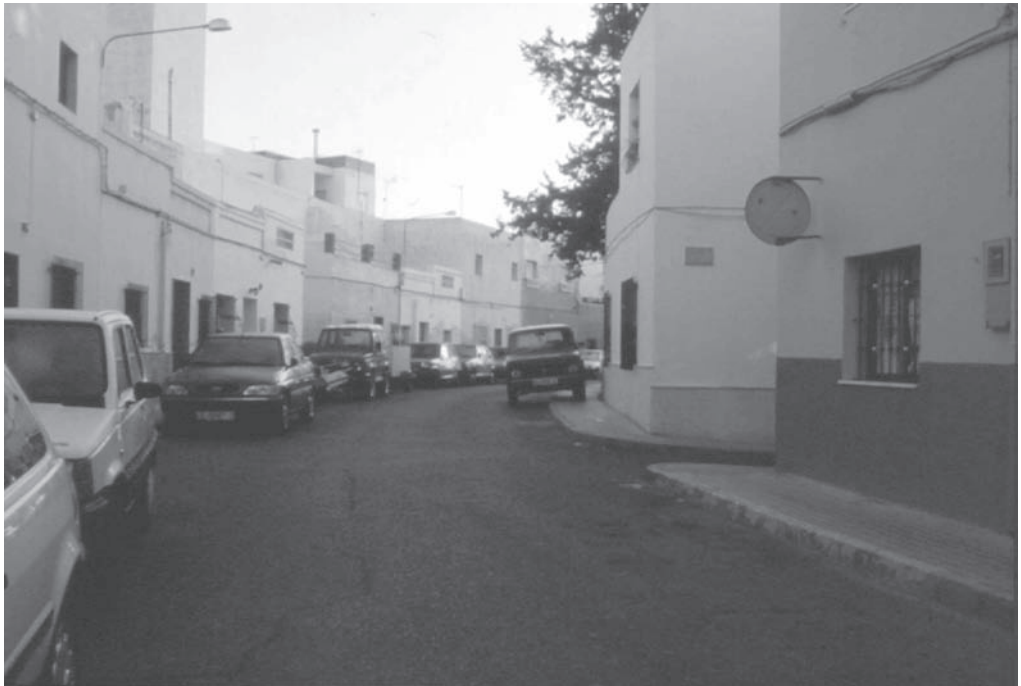
4. Barriada de Regiones. C/ Redonda en la actualidad.

Las actuaciones emprendidas desde 1939 debían formar parte de una estrategia unitaria nacional de reconstrucción y que se plasmará teóricamente por el régimen en Ideas generales sobre el Plan Nacional de Ordenación y Reconstrucción , donde se planteaba un nuevo modelo urbano frente a la ciudad heredada, supuestamente de carácter caótico y decadente. La creación de la Dirección General de Regiones Devastadas debía ser el vehículo para estas actuaciones urbanísticas de carácter “modélico” y para desarrollar un “constructivismo” permanente, un estado en obras rápido en solucionar el problema de la vivienda en Almería y en ofrecer una imagen atractiva para vender la imagen de la “nueva España”, aunque ya veremos como habrá “mucho ruido y pocas nueces”. Este organismo creado en 1938 dentro del Ministerio del Interior, con lo cual se aprecia su importante compromiso político, debía ser el portavoz de la reconstrucción, entendida como necesidad y propaganda.