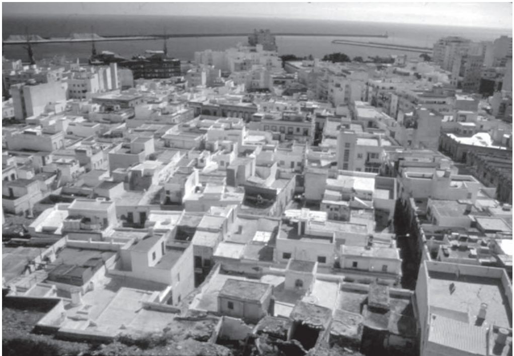
19. Vista aérea de la Almería “vertical” surgida desde los años 60.

Las primeras voces de protesta y un mínimo de sentimiento de culpabilidad por parte de la corporación municipal ante el caos reinante obligarán a que el 11 de Septiembre de 1969 se aprueben unas nuevas ordenanzas para preservar el casco histórico y otras zonas de cierta personalidad arquitectónica, como Ciudad Jardín, del deterioro arquitectónico por la libertad de la normativa anterior.