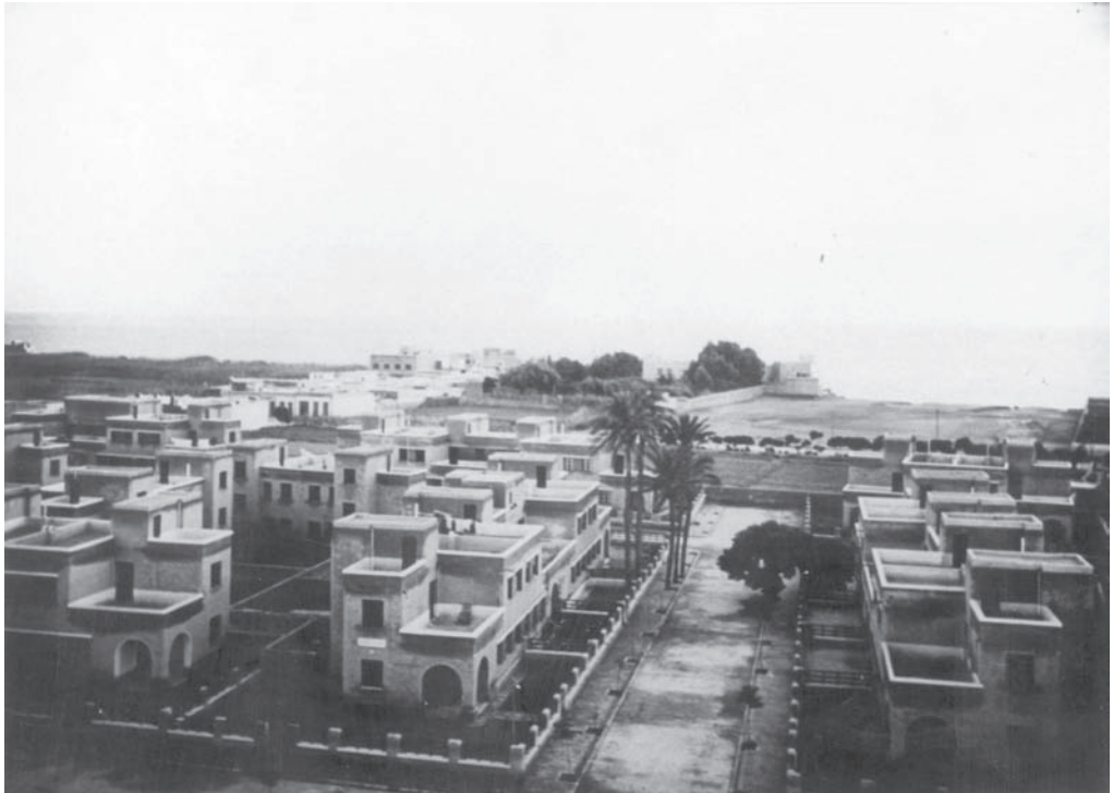
9. Barriada de Ciudad Jardín, con el mar al fondo.