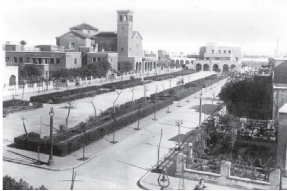
8. Barriada de Ciudad Jardín. Plaza de España.

Pero el ejemplo más característico de este urbanismo y arquitectura de posguerra en Almería será la barriada de Ciudad Jardín, proyectada en 1940. Es el primer intento de adaptar a nuestra ciudad, aprovechando la expansión urbana a Levante, el diseño propuesto por el teórico Ebenezer Howard en Inglaterra a finales del XIX, como ciudad jardín alternativa a la ciudad industrial mediante una unión de campo y ciudad, con la existencia de amplias zonas verdes y el jardín dentro de la propia vivienda.