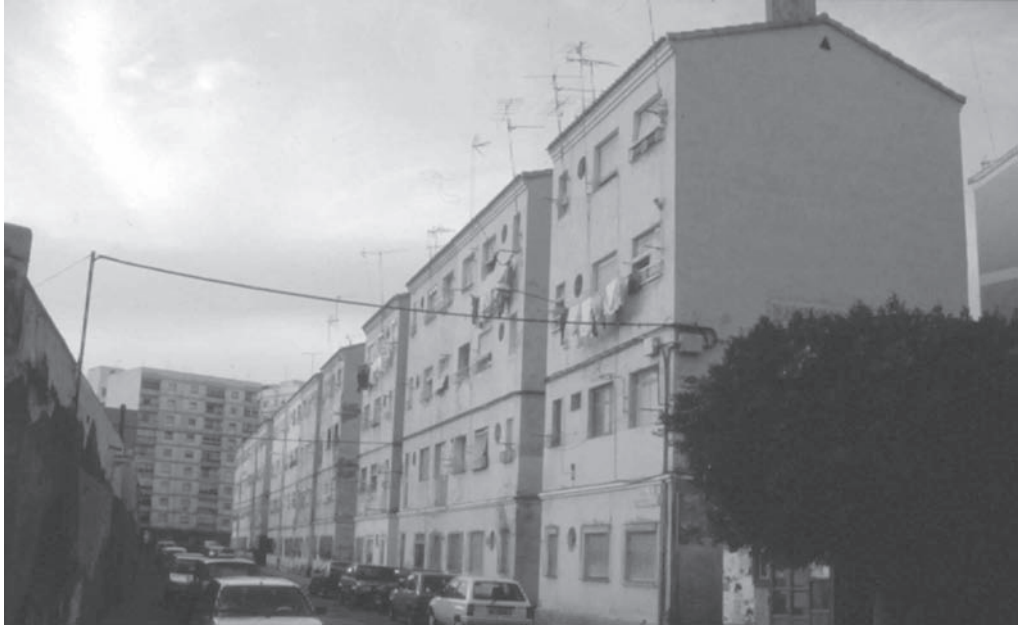
15. Grupo de viviendas sindicales “Alejandro Salazar”.

Vivienda (grupo de la Plaza de Toros, junto a la rambla de Belén) o el Ayuntamiento (grupo de viviendas para maestros en la avenida de Vilchez y 80 viviendas en la calle Paco Aquino).