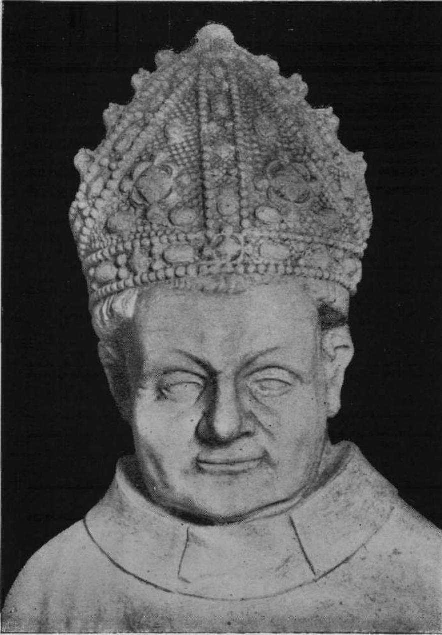
El Obispo de Pamplona Don Sancho Sánchez de Oteiza. Busto de su estatua sepulcral en su capilla de la Catedral de Pamplona,