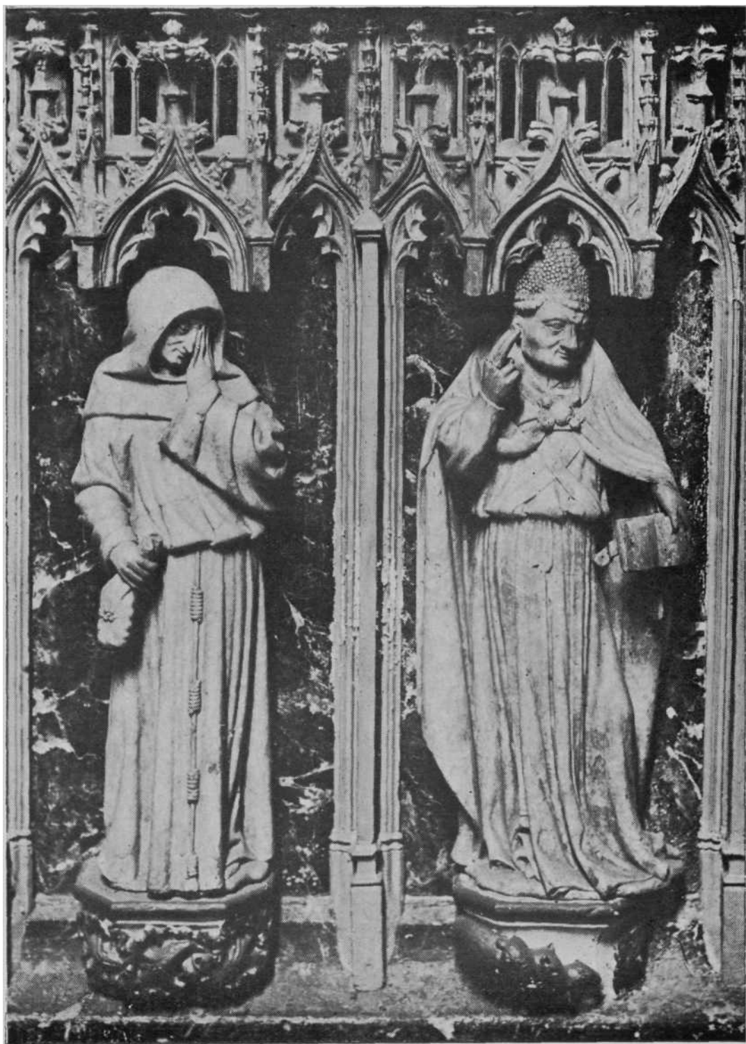
Posible representación del Obispo Don Sancho de Oteiza, en el Sepulcro de Carlos el Noble, y de un fraile plorante