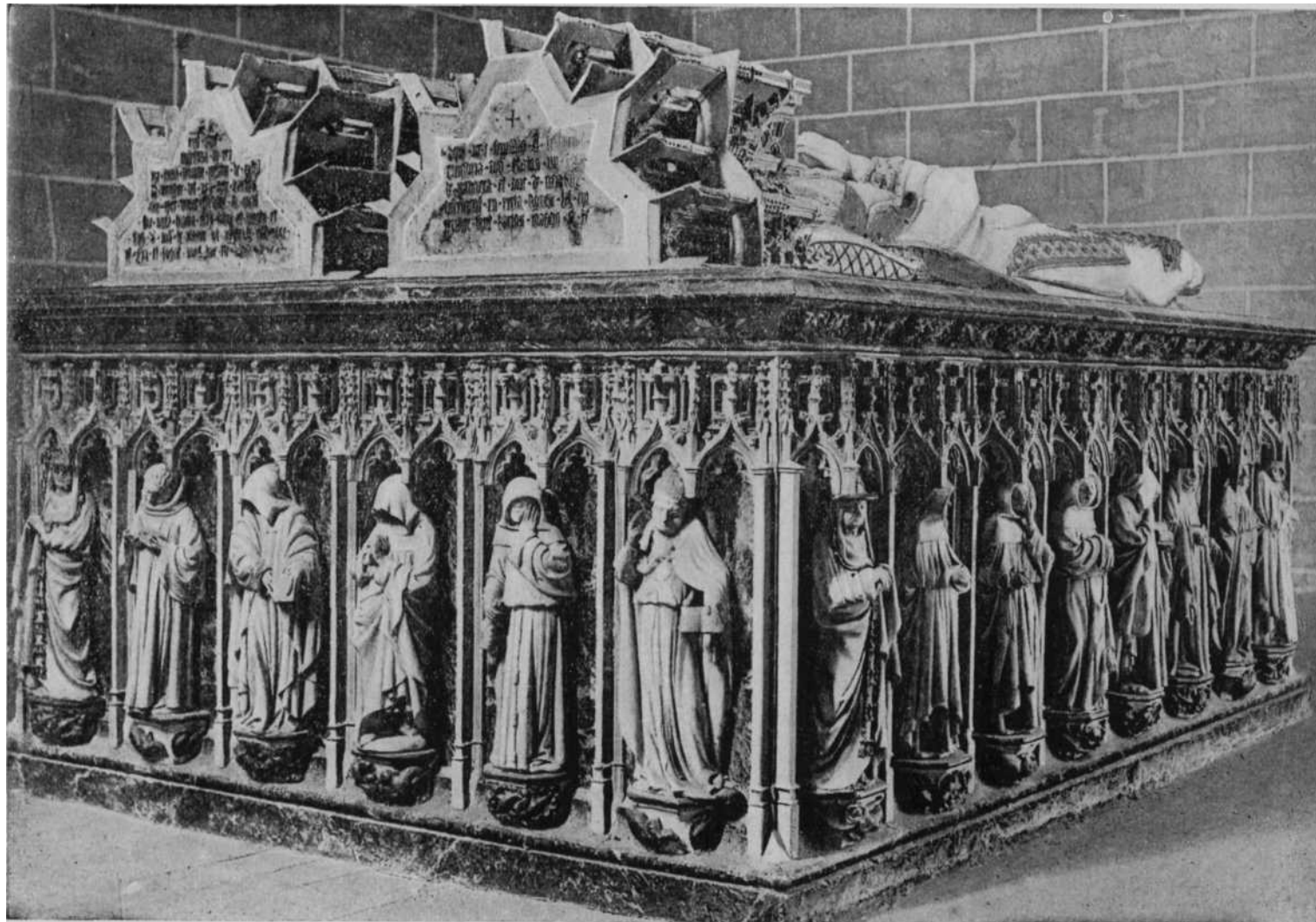
Cabecera del sepulcro de los Reyes de Navarra Carlos el Noble y Doña Leonor.— Supuesta figura del obispo Don Sancho de Oteiza y de los dos cardenas Zalba