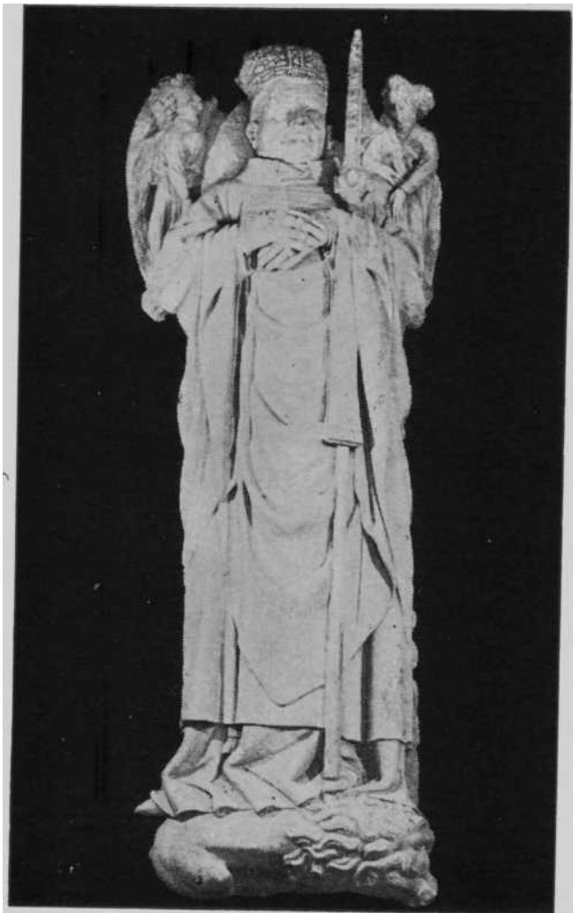
Estatua yacente del Obispo Sancho Sánchez de Oteiza en la Catedral de Pamplona