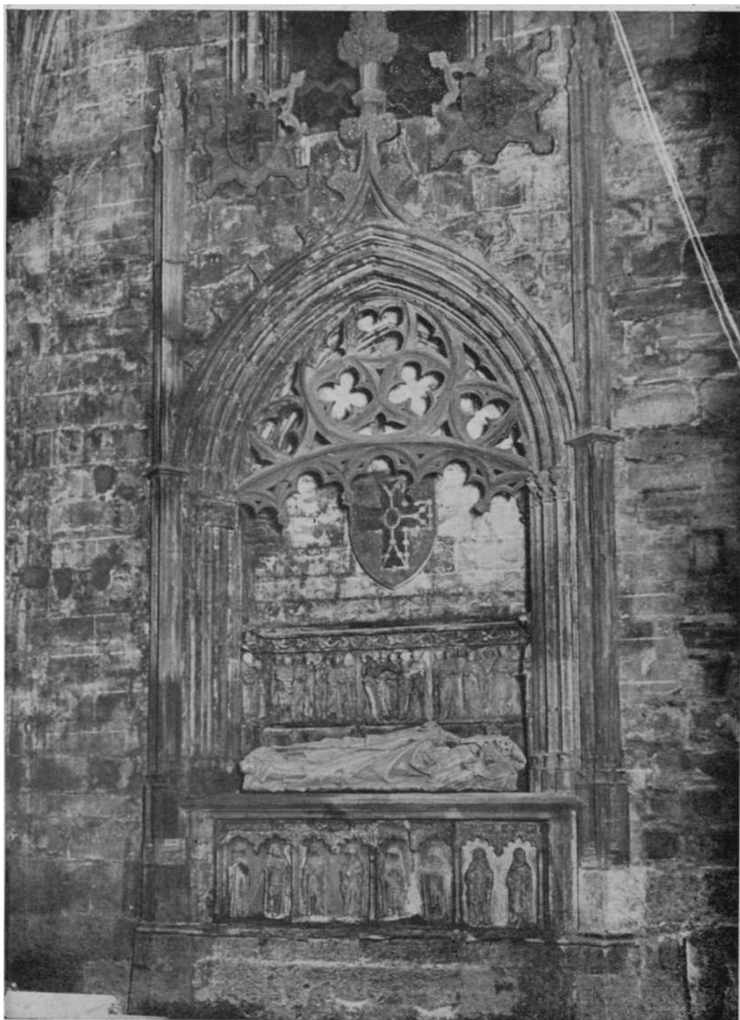
Sepulcro del Obispo de Pamplona Don Sancho Sánchez de Oteiza en la Catedral de Pamplona.—Sus armas en el pavés.