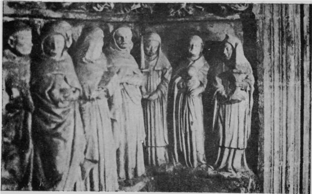
Detalle del sepulcro del Obispo Don Sancho Sánchez de Oteiza en Pamplona