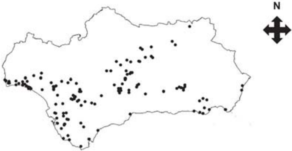
FIG. 3.- Localización geográfica de los humedales incluidos en el Inventario Abierto de Humedales de Andalucía.