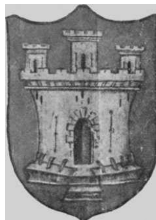
Fig. 10—Tabla pintada en 1582 para el presbiterio de Santa María.