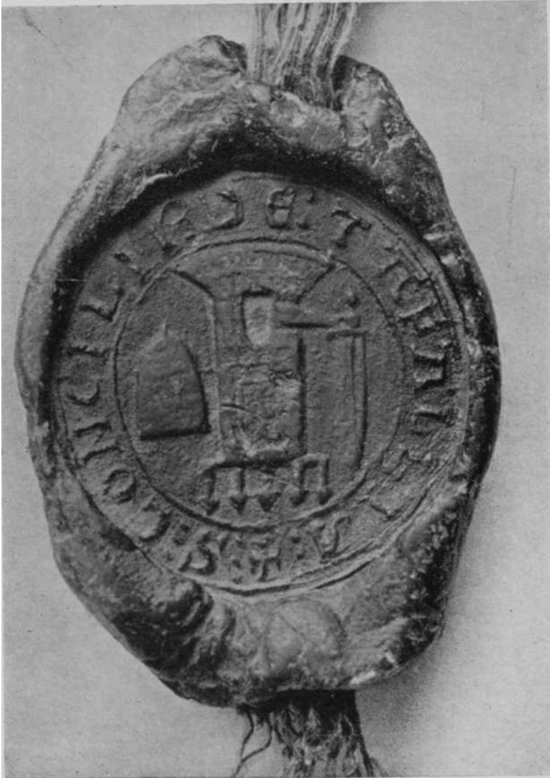
Fig. 1—Sello céreo pendiente en un documento de arbitraje entre Tafalla y Olite: 1253.