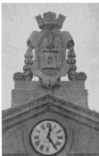
Fig. 8 —Escudo en el frontispicio de la Casa consistorial. 1857