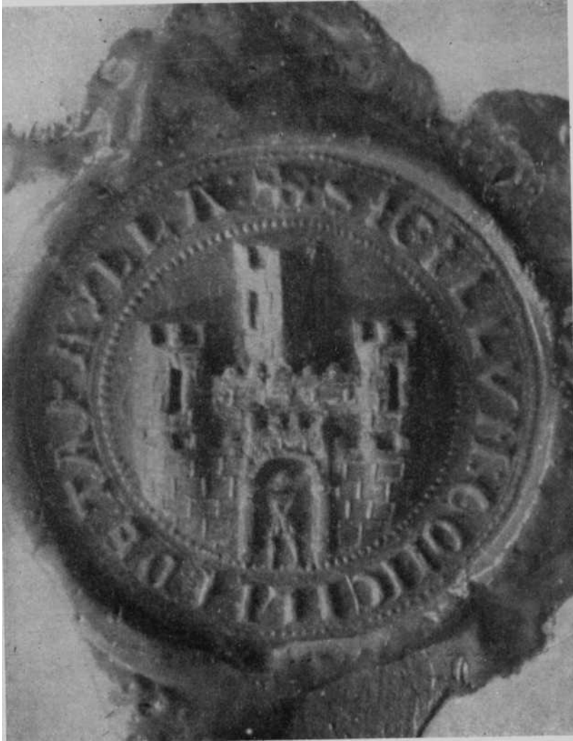
Fig. 3—Sello céreo pendiente de las ordenanzas del Concejo de Tafalla: 1309.