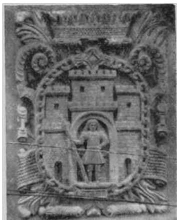
Fig. 6 — Escudo mural de la antigua Casa municipal.