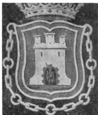
Fig 9—Escudo del salón de sesiones.