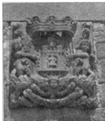
Fig. 7—Escudo mural en la fachada de Capuchinos.