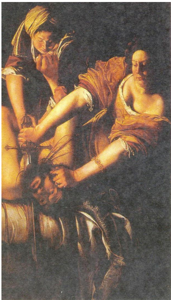
"Judith decapitando a Holofernes". Artemisia Gentileschi

Un desnudo naturalista ocupa el centro de la obra: el lugar preeminente es para la angustiada Susana. Lo primero que vemos es a la bella mujer que está siendo acosada. Una línea formada por los ropajes que cubren las espaldas de los viejos vuelve a enmarcar la acción dentro de una disposición piramidal clásica que se recorta ahora sobre un cielo brillante. Hay en él algunas nubes. El cielo arriba, el agua abajo, ramas talladas en la piedra del banco que sustenta el cuerpo protagonista establecen los límites de la acción. Esta es la frugal naturaleza con la que Artemisia aísla a Susana. La naturaleza no es aquí la exuberante metáfora de la feminidad —como ocurre en la Susana de Tintoretto o en la de Rubens—, sino más bien los límites que enmarcan a la protagonista. Límites que pueden traspasarse y que, de hecho, su pie tímidamente traspasa.