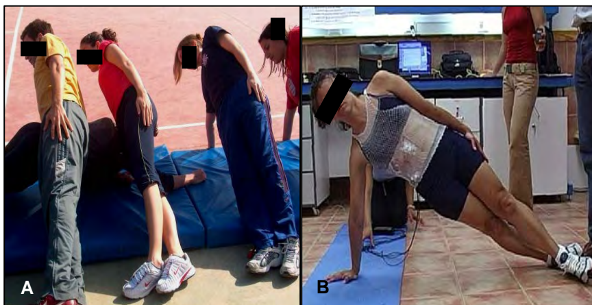
Figura 1. El túnel o puente (TU): Los participantes se colocan en decúbito prono formando dos filas o equipos. El primer jugador de cada equipo empieza a pasar por debajo de sus compañeros que le facilitan el paso adoptando diversas posturas, como por ejemplo, la mostrada en las imágenes. El equipo que consigue que todos los jugadores pasen en el menor tiempo posible gana el juego. A) Imagen del juego en situación real; B) Imagen de la postura seleccionada para su estudio.