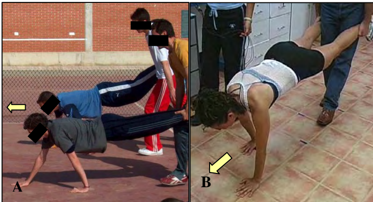
Figura 4. La carretilla (CA): El objetivo del juego es completar por parejas un recorrido establecido de antemano. Como muestran las imágenes, la forma de desplazamiento se asemeja a la realizada al desplazar una carretilla. Un participante sostiene y empuja a su compañero por los tobillos, para que este se desplace por todo el recorrido mediante apoyos sucesivos de las manos. A) Imagen del juego en situación real; B) Imagen de la tarea seleccionada para su estudio.