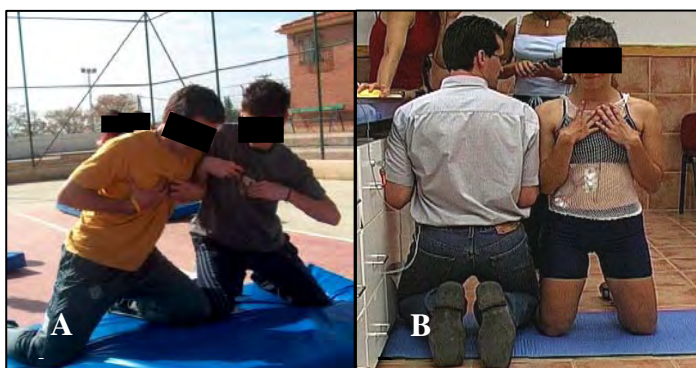
Figura 2. La pelea de gallinas (GA): los participantes se sitúan por parejas, de rodillas, hombro con hombro y con el dedo pulgar en las axilas. Cada jugador trata de derribar a su oponente empujando con sus hombros y tratando de desequilibrarlo. el jugador que derriba tres veces a su oponente gana el “combate”. A) Imagen del juego en situación real; B) Imagen de la tarea seleccionada para su estudio.