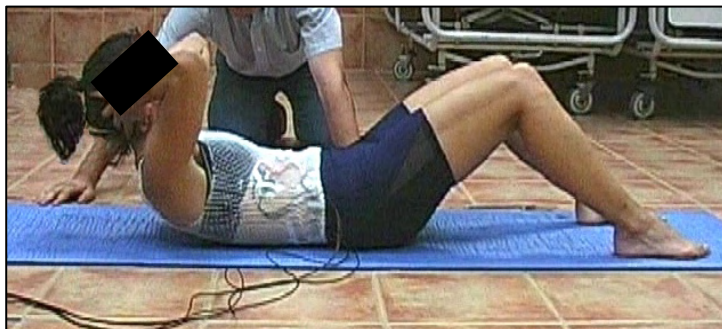
Figura 5. Posición de encorvamiento del tronco (ET).

El ejercicio de encorvamiento del tronco (ET) es una tarea utilizada habitualmente para el acondicionamiento de los músculos del abdomen en diferentes ámbitos: educativo, recreativo, deportivo, etc. Su realización consiste básicamente en la flexión, desde decúbito supino, de la parte superior del tronco en sentido cráneo-caudal hasta que el ángulo inferior de la escápula despega de la superficie (Figura 5).