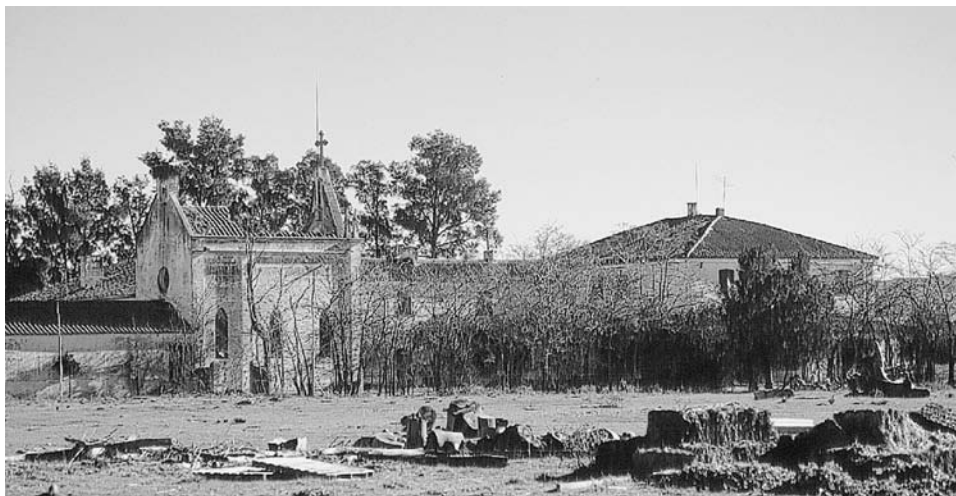
FIG. 4. Mesas Altas (Acedera, Badajoz).