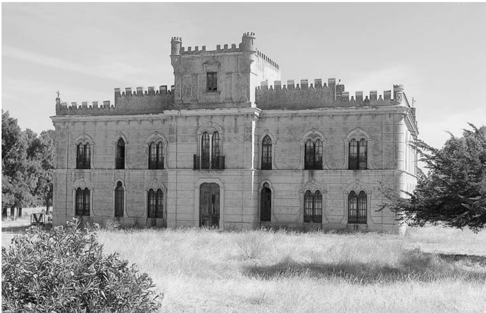
FIG. 2. Palacio del Conde de la Oliva en la finca La Zapatera (Oliva de Mérida, Badajoz).