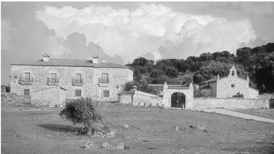
FIG. 7. La Matilla de los Almendros (Trujillo, Cáceres).