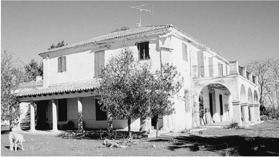
FIG. 6. Casa principal de Mesas Altas (Acedera, Badajoz).