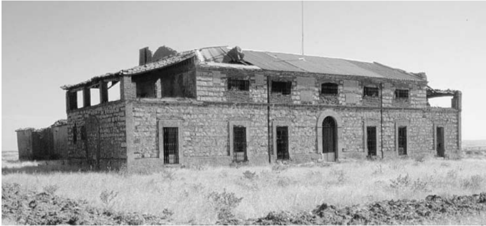
FIG. 1. Casa de La Pared (Quintana de la Serena, Badajoz).