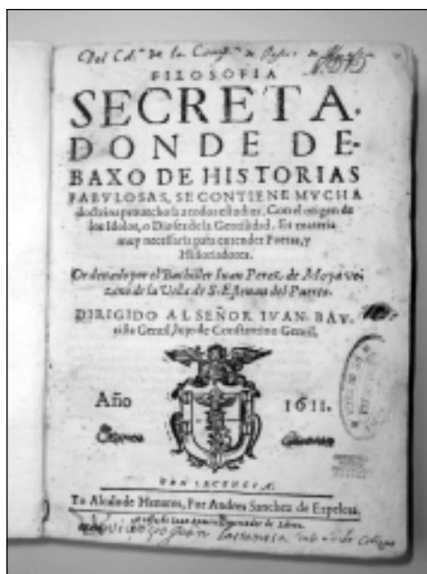
Portada de Filosofía secreta... , de Juan Pérez de Moya (Biblioteca Pública de Huesca).