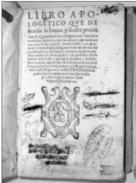
Portada del Libro apologético..., de Miguel de Salinas (Biblioteca Pública de Huesca).

De la Biblioteca de VINCENCIO DE LASTANOSSA, Cavallero Infançón, Ciudadano de Huesca, y Señor de Figaruellas